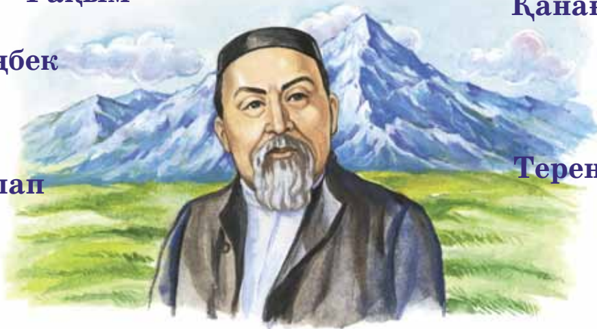
«Бес асыл іс» шыңы