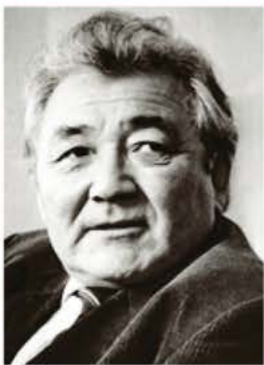
Тахауи Ахтанов (1923–1994)

Тахауи Ахтанов – қазақ әдебиетіне көрнекті шығармаларымен мұра қалдырған тұлғалардың бірі, Қазақстан Мемлекеттік сыйлығының лауреаты, Қазақстанның халық жазушысы.