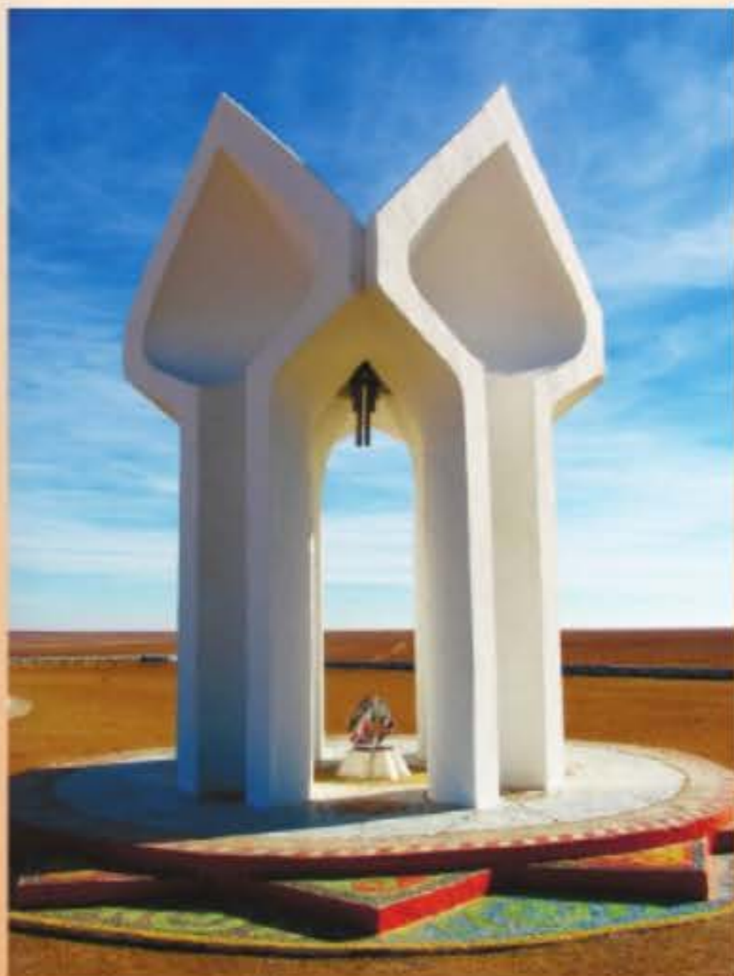
Қорқыт Ата мемориалдық кешені. Қызылорда облысы

жарияланған фотосурет арқылы белгілі. Мазардың бұрынғы орнына бүгінде мемориалдық тақта орнатылған.