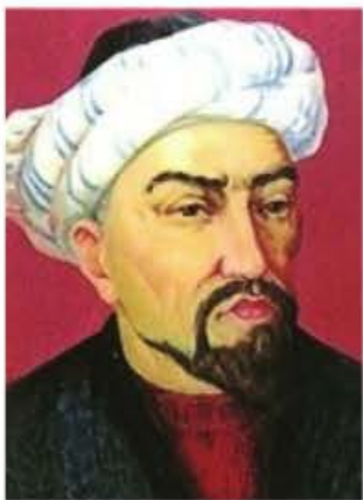
Ахмет Ясауи (1093–1166)

Қазақ халқы үшін Қожа Ахмет Ясауидің есімі ерекше қадірлі. Ол – ақын, философ, ислам дінінің көрнекті өкілі. Оның қай жылы өмірге келгені туралы нақты дерек жоқ. Ғалымдар арасында 1093, 1040, 1103, т.б. жылдар аталады. Ахмет Ясауи өзінің діни ұстанымына байланысты 63 жасында қылуетке кірген. Оның жер астынан қазып жасалған құлшылық мекенінде (қылуетте) нақты қанша жыл өмір сүргенін айту қиын. Тек болжамдар ғана жасалады.