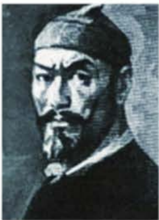
Мұрат Мөңкеұлы (1843–1906)

Мұрат Мөңкеұлы – қазақ тарихында, әдебиетінде көрнекті орны бар тұлға. Ол 1843 жылы қазіргі Атырау облысы Қызылқоға ауданы Қарабау ауылында дүниеге келген. Әкесі адал еңбегімен күн көрген шаруаның адамы, анасы өнші әрі ақын болған. Мұрат бабамыздың ақындық қабілетінің шыңдалуына анасының және үлкен ағасы Матайдың ықпалы ерекше болды.