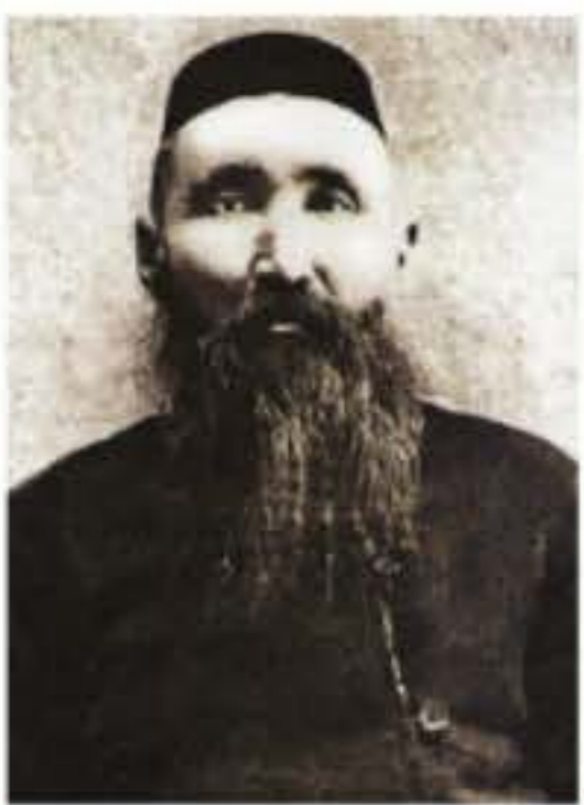
Шәкәрім Құдайбердіұлы (1858–1931)

Шәкәрім Құдайбердіұлы – ақын, жазушы, философ, тарихшы, композитор. Ол 1858 жылы Шыңғыс тауының бөктерінде, Семей өңірінің Абай ауданында дүниеге келген. Осы жер атауының өзі оның дана Абай Құнанбайұлына туыстығын танытады. Шәкәрімнің әкесі Құдайберді Құнанбайдың бәйбішесі Күңкеден туған. Сондықтан Шәкәрім – Абайдың немере інісі болады.