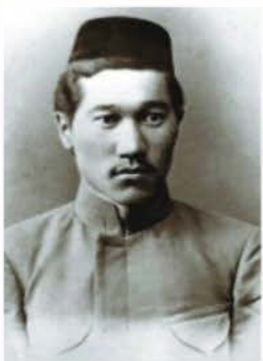
Міржақып Дулатұлы (1885–1935)

Міржақып Дулатұлы 1885 жылы 25 қарашада бұрын Торғай облысы деп аталған, қазіргі Қостанай облысы Жангелдин ауданында дүниеге келген. Ол екі жасында анасынан, он жасында әкесінен айырылып, ағасы Асқар Дулатовтың қолында болған. Ауыл молдасынан сауат ашып, кейін орысша оқытатын Мұқан Тоқтабайұлы деген мұғалімнен дәріс алған.