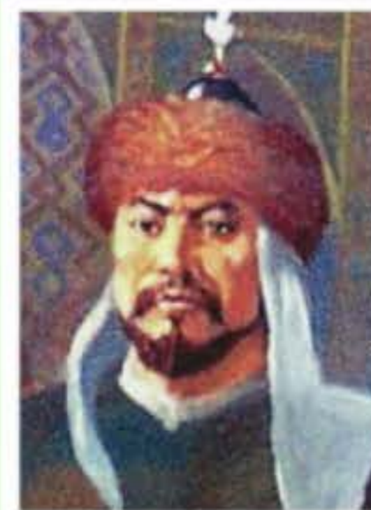
Ақтамберді Сарыұлы (1675–1768)

Ақтамберді Сарыұлының ақындық таланты ерте байқалған. Ол 10–11 жасында-ақ өлең шығара бастаған. Ал 17-ге толғаннан кейін қазақтардың Моғолстанға, Жоңғарияға жасаған жорықтарына қатысып, ұрыстарда қаһармандық көрсеткен. Оның: