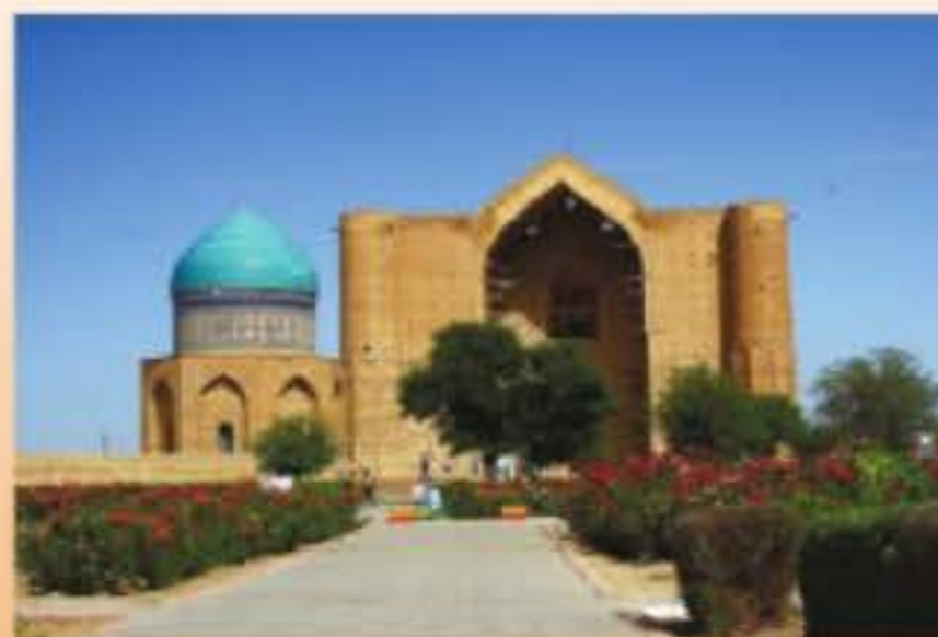
Қожа Ахмет Ясауи кесенесі. Түркістан қаласы

Ахмет Ясауиді Түркістандағы халық, ислам жолындағы адамдар әулие деп қадірлеген.