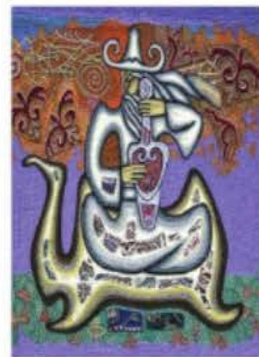
Шалкиіз жырау (1465–1560)

Шалкиіз жыраудың әдеби мұралары, басқа жырауларға қарағанда, көбірек жеткен. Отызға жуық толғауы бар. Бұл толғаулардан Шалкиіз