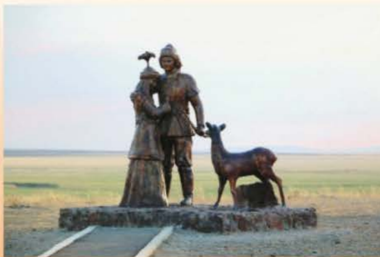
Еңлік пен Кебек ескерткіші. Шығыс Қазақстан облысы Абай ауданы

Бүгінде Шығыс Қазақстан облысы Абай ауданында Еңлік пен Кебекке арналған ескерткіш орнатылған.