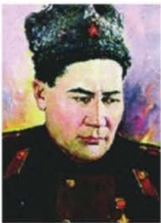
Бауыржан Момышұлы (1910–1982)

Бауыржан Момышұлы 1910 жылы 24 желтоқсанда Жамбыл облысы Жуалы ауданы Көлбастау қонысында, малшы отбасында дүниеге келген. Он үш жасқа дейін ауылда, одан соң, интернатта жатып оқыды. Сосын біраз уақыт мектепте мұғалім болды. Осыдан кейін 1932 жылы әскерге алынып, мергендік өнерді меңгерді. 1936 жылы әскерге қайта шақырылып, содан әскери қызметте қалды. 1941 жылы Ұлы Отан соғысы басталғанда, генерал-майор, жерлесіміз И.В. Панфиловтың басшылығымен Алматыда жасақталған 316-атқыштар дивизиясы құрамында майданға аттанды. Оның әскери өмірі үлкен жауапкершілікті сезінумен өтті. Бірақ, бір өкініштісі, оған тиісті