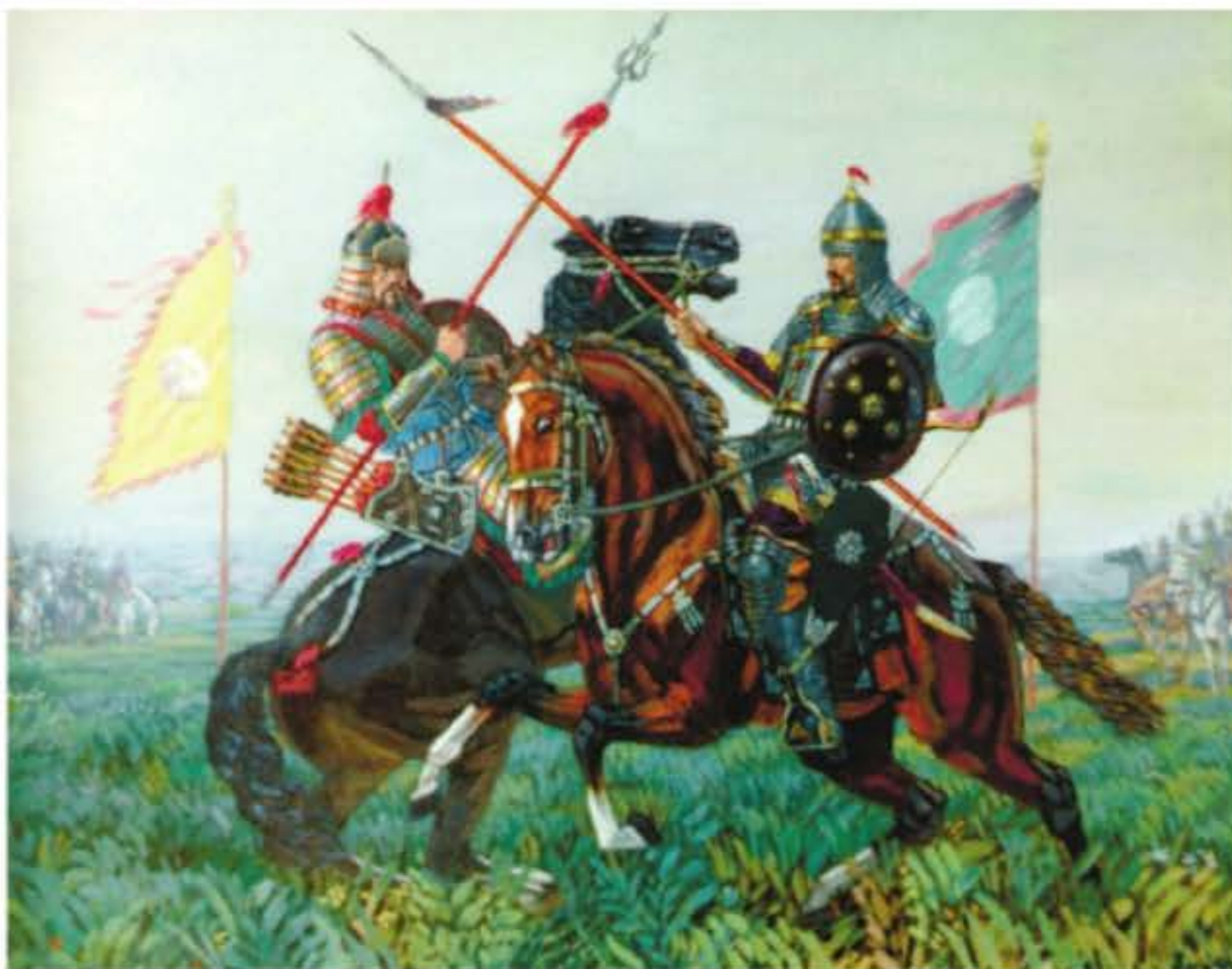
“Жекпе-жек”. Авторы: Қ. Ахметжан

көрсетпесе, өкеле жатқан тауарларыңыз Грузия жерінде қалған болар еді, біздің бәріміз тұтқында кеткен болар едік», – десті. Байбөрі оларға: «Айтыңдар, менің балам жаулардың басын кесіп, қан төкті ме?» – деді. «Иә, ол көп адамның басын кесіп, жерді қанға бояды», – десті көпестер. «Ендеше оған ат қоятын мезгіл өтіп те кеткен екен» деп, Байбөрі барлық оғыз елінің бектерін шақырып, той қылды. Сол тойға менің атам Қорқыт келіп, балаға ат қойды. Тойда отырып, ол: «Сөз тыңда, Байбөрі бек! Тәңірі саған ұл берді, өмірі ұзақ болсын. Ол оғыздардың тірегі, ту ұстайтын батыры болсын. Басынан қар кетпейтін биік тауларға шығамын десе, ұлың соның ең биік құзына шығатын болсын. Ағысы қатты қан сасыған өзендерден өтемін десе, Тәңірі оның жүзіп өтуіне жар болсын. Ұлың қара ормандай жау ортасына кірер болса, Тәңірі оның ісіне сәт берсін. Ұлыңның атын «Бамш» деп атап жүр едің, ендігі аты Бамсы-Байрақ болсын, мінген аты Байшұбар деп аталсын. Менің қойған атым – сол, Тәңірім оның жұрымын берсін», – деді. Оғыз елінің бектері бұл билікке қол көтеріп, жақсы тілек білдірді. «Ұлыңның аты өзіне сай болды, бақытты болсын», – деп, бата берді.