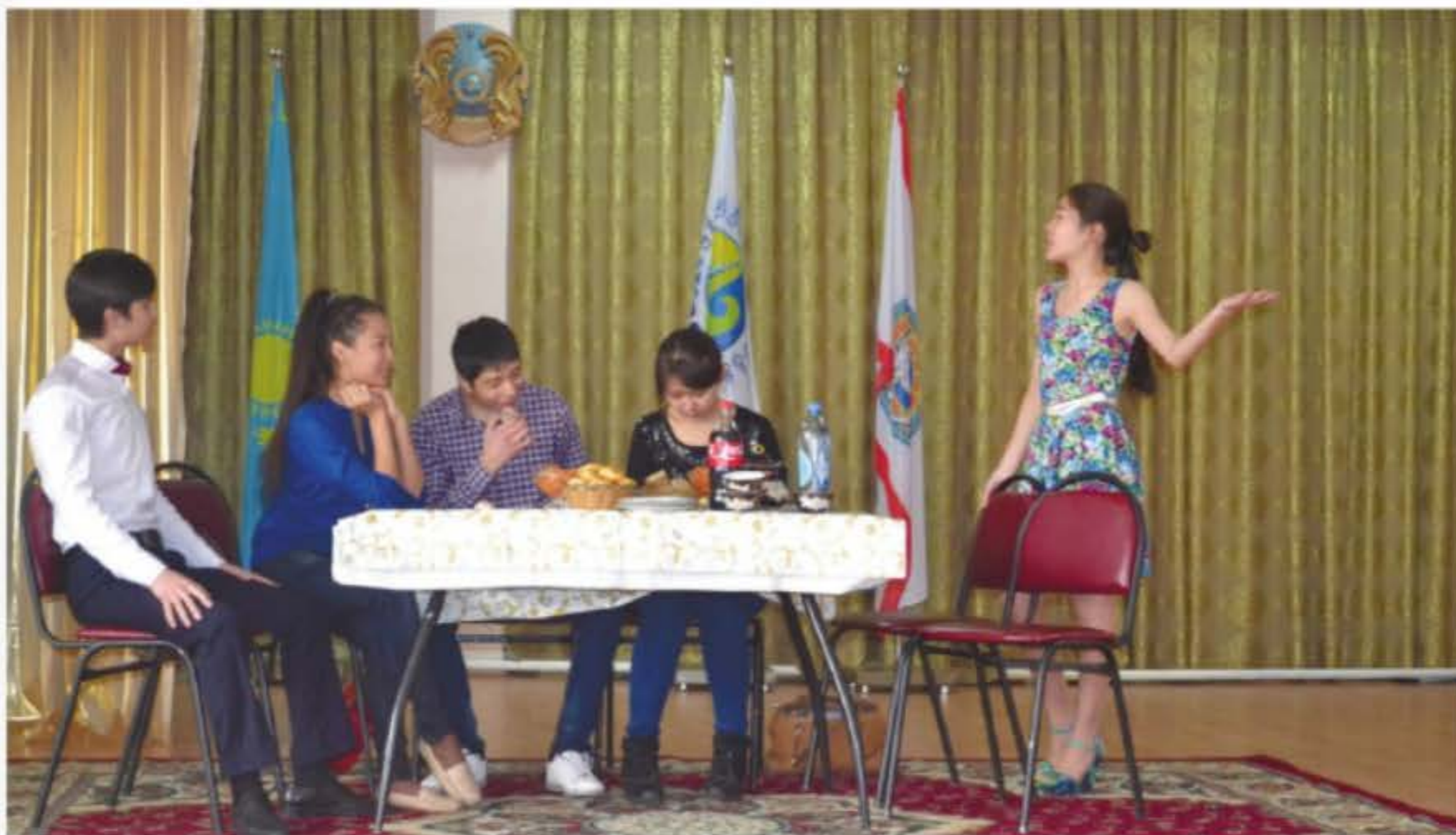
Алматыдағы №119 мектептің 8–10 сынып оқушылары Дулат Исабековтің «Өпке» пьесасын сахналады

Қамажай. Жоқ, күтпей-ақ қой. Ал, сау бол. Қош. Қош!