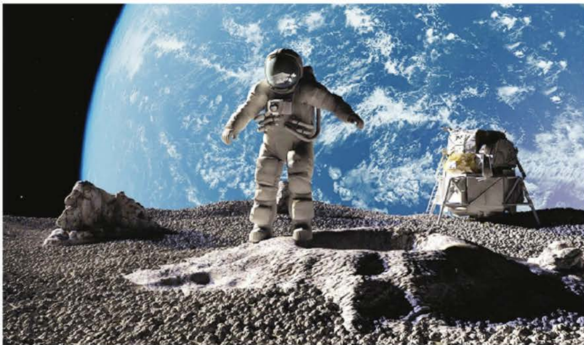
Құпияға толы планета

Артынша кеңк-кеңк күлгені де микрофонды қырылдатып жіберді. Мен де күлдім. Бірақ сонда да сыры беймәлім табиғатқа сенбей жүрексінемін. «Айда серуендейміз деп жүріп, бір-бірімізді жоғалтып алсақ» деген үрейлі ой билей бастады. Өрі-бері қарап: