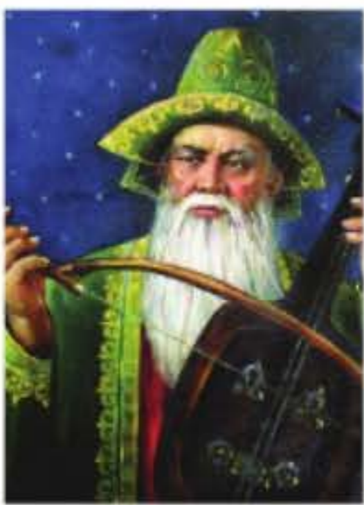
Қорқыт ата (VIII–X ғасыр)

Қорқыт атаның есімі тек қазақ халқы үшін ғана емес, бүкіл түркі халықтарына ардақты. Атап айтқанда, өзербайжан, башқұрт, түрік, түркімен, т.б. ұлттардың орта ғасырлардағы мәдени мұрасынан белгілі. Өйткені ол – түркі халықтарының орта ғасырлардағы тарихына ортақ тұлға. Бір кездері Түркі қағанатына біріккен тайпа, руларды құраған халықтар кейін жеке ұлттарға бөлінгенде де, бабаларынан қалған сөздерді ұмытпаған.