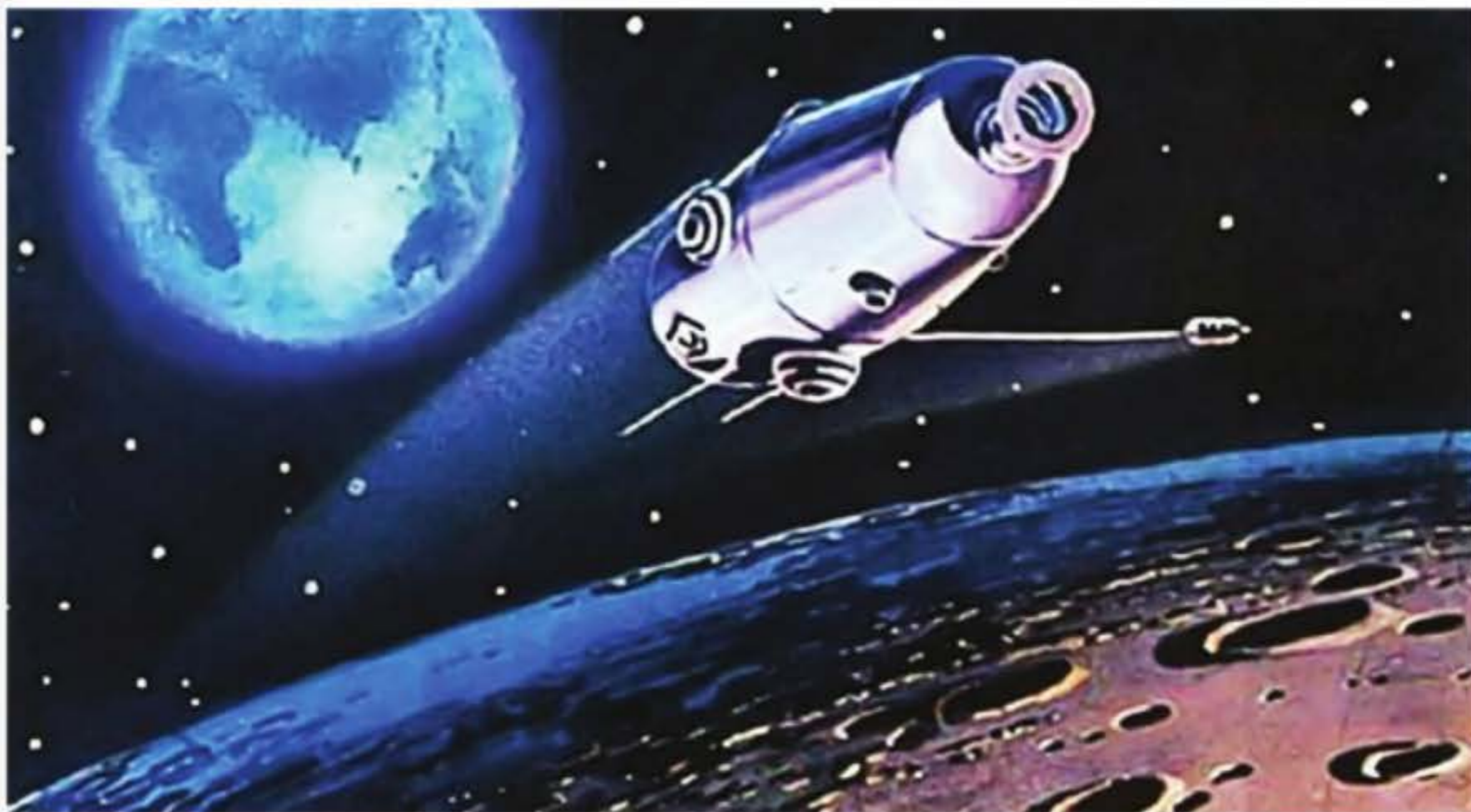
Автоматты планетааралық станция (АМС)

Қуырдақ келгенше үй іші мұнда бұрыннан қоныстанған адамдар отырғандай, күбір-күбір әңгіме-дүкенге, емен-жарқын өзілге толды. Жасаған