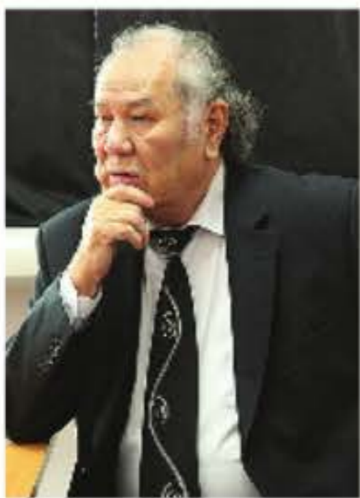
Дулат Исабеков (1942 жылы туған)

Дулат Исабеков – қазіргі заманның көрнекті жазушысы, драматург. Ол 1942 жылы 12 желтоқсанда Оңтүстік Қазақстан облысы Сайрам ауданында дүниеге келген. Қазақ мемлекеттік университетін бітірген. Қазақ телевизиясының бас директоры, «Жазушы» баспасының директоры, т.б. көптеген жауапты қызметтерді атқарған.