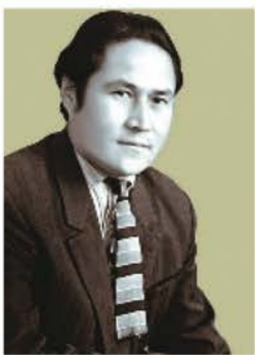
Мұқағали Мақатаев (1931–1976)

Мұқағали Мақатаев – қазақ әдебиетінде ақиық ақын атанған көрнекті тұлға. Оның азан шақырып қойған аты – Мұхаметқали. Ол 1931 жылы 9 ақпанда Алматы облысы Нарынқол, қазіргі Райымбек ауданына қарасты Қарасаз ауылында туған. Әкесі 1941 жылы Ұлы Отан соғысы басталғанда, майданға аттанып, ерлікпен қаза тапқан. Сондықтан Мұқағали Мақатаев бала кезден еңбекке араласты. Қой бағып, егін орып, кетпен шауып, тірлік жасап жүрсе де, ауылдағы мектепті үздік бітірді. 1948 жылы Алматыдағы Қазақ мемлекеттік университетінің филология факультетіне оқуға түсті. Бірақ ауылдан келген балаларға жатақхана берілмегендіктен, оқуын жалғастыра алмады. Содан ең-