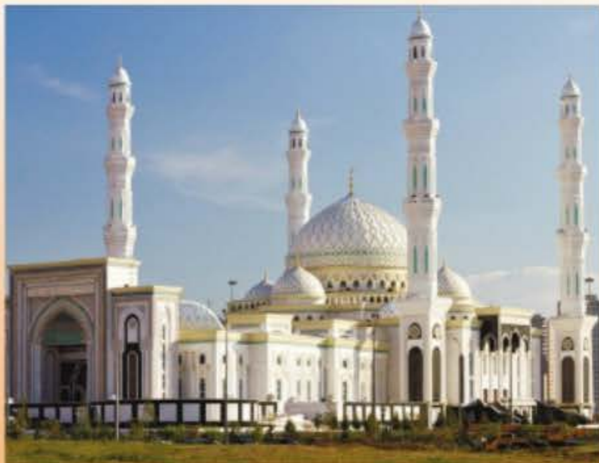
Әзірет Сұлтан мешіті. Астана қаласы

Әзірет Сұлтан мешіті – Астана қаласында орналасқан классикалық ислам үлгісіндегі мешіт. Ол қазақтың дәстүрлі ою-өрнектері мен ұлттық нақыштағы сәндік белгілерін қолдану арқылы жасалған.