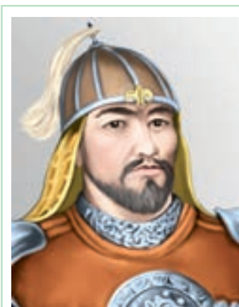
ШАЛКИІЗ ЖЫРАУ (1465–1560)