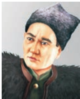
БАУЫРЖАН МОМЫШҰЛЫ (1910–1983)

Бауыржан Момышұлы 1910 жылы Жамбыл облысы, Жуалы ауданында қарапайым отбасында дүниеге келген. Әкесінен хат таныған Бауыржан көрші ауылдағы орыс мектебінде, Жамбыл қаласындағы Аса интернатында білім алып, бастауыш мектепті бітіреді. 1921 жылы Шымкенттегі жеті жылдық мектепке түсіп, оны 1928 жылы аяқтайды. Жиырма жастан асқан кезде ол міндетті әскери қызметке шақырылып, өзінің болашағын Қызыл Армиямен мәңгілікке байланыстырады.