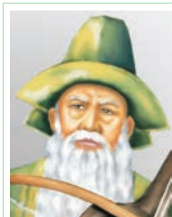
ҚОРҚЫТ АТА (VIII–X ҒАСЫРЛАР)

Қорқыт – ақын, жырау, күйші, қобызшы, өз дәуірінің ойшылы. Ол атақты батыр, сөзіне хандар құлақ асқан ақылгөй данышпан болған. Аңыз-әңгімелерде Қорқыттың туған жылы мен жасы туралы әртүрлі пікірлер айтылады. Кейбір деректер Қорқытты 95 жыл жасаған десе, кейбірінде 195, тіпті 400 жыл жасаған деген де болжамдар бар.