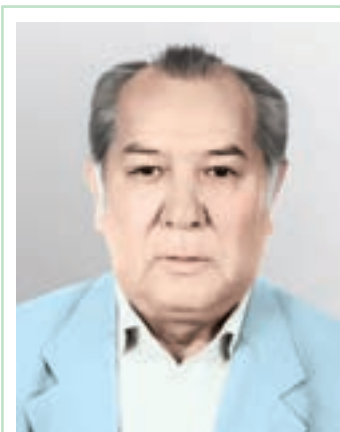
ДУЛАТ ИСАБЕКОВ (1942 жылы туған)