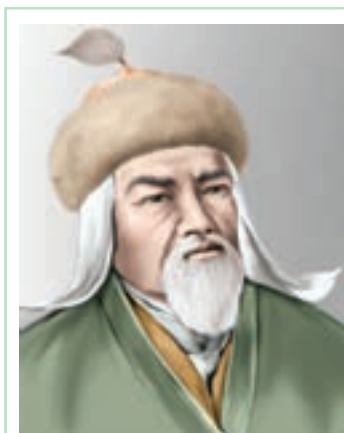
МҰРАТ МӨҢКЕҰЛЫ (1843–1906)

Мұрат Мөңкеұлы 1843 жылы қазіргі Атырау облысының Қызылқоға деген жерінде бай-қуатты отбасында дүниеге келген. Алайда әкесінен ерте айырылған Мұрат ағасының тәрбиесінде болады. Жастайынан өлең-жырға әуес болып, «ақын бала» атанған.