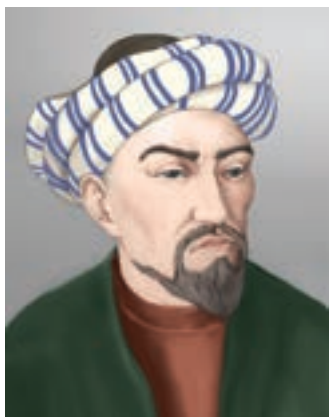
ҚОЖА АХМЕТ ЯСАУИ (XI ғ.)