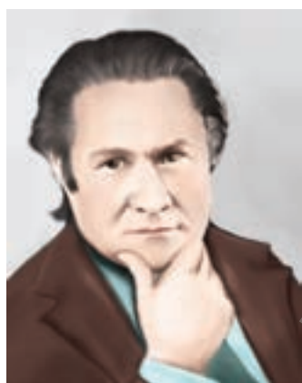
МҰҚАҒАЛИ МАҚАТАЕВ (1931–1976)

Қазақтың ақиық ақыны Мұқағали Мақатаев Алматы облысы Райымбек ауданы Шалкөде ауылында туған. Балалық шағы Екінші дүниежүзілік соғыс жылдарының қиыншылықтарымен дәл келгендіктен, болашақ ақын өмірдің ащы-тұщысын ерте татады: ерте есейіп, арба айдап, соқа салып, тырма тартып, шөп шауып, масақ терді. Өзінің балалық шағын ақын: