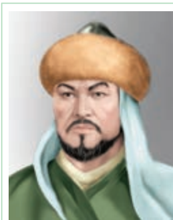
АҚТАМБЕРДІ ЖЫРАУ (1675–1768)