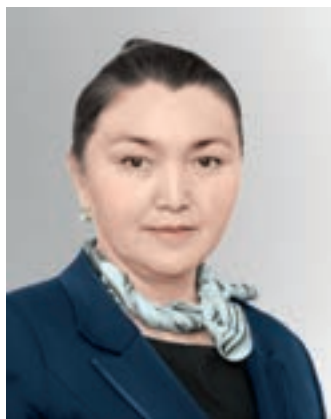
РОЗА МҰҚАНОВА (1964 жылы туған)

Танымал қазақ жазушысы Роза Мұқанова 1964 жылы Шығыс Қазақстан облысы Үржар ауданы Көлденең ауылында дүниеге келген.