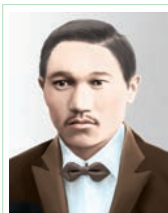
МІРЖАҚЫП ДУЛАТҰЛЫ (1885–1935)