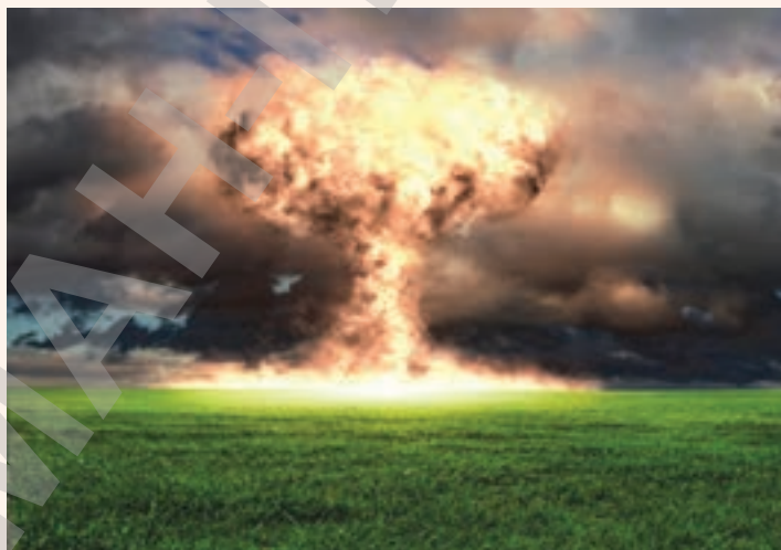
Ядролық жарылыстан кейін пайда болатын «саңырауқұлақ»

маңындағы радиациялық әсер аймағында тұратын 500 мыңдай адам осы сынақтан азап шекті. Семей ядролық полигонындағы сынақтардың жалпы саны 456 ядролық және термоядролық жарылысты құрады. Олардың 116-сы ашық болды, яғни жер бетінде немесе әуе кеңістігінде жасалды. Семей полигонында әуеде және жер бетінде сынақтан өткізілген ядролық зарядтардың жалпы қуаты 1945 жылы Хиросимаға тасталған атом бомбасының қуатынан 2,5 мың есе көп болды. 1949 жылғы 29 тамызда таңғы сағат жетіде көз ілеспес жылдамдықпен ұлғайып бара жатқан отты доп кенеттен Жер денесіне қадалып, оны шарпып өтіп, аспанға көтерілген. Отты шардан соң, сұрапыл қуат пен көз қарықтырар сәуле бас айналдырып жібергендей бір сәтте жер қабығының ыстық күлі мен иісі көкке көтерілген. Жер лыпасының өртең иісі қолқа атар түтіннің ащы иісін қолдан жасалған жел әп-сәтте жан-жаққа таратты. Таяу жерлердегі сирек ауылдарда тұратын адамдар дір ете түскен жер мен жарты аспанды алып кеткен от-жалынға таңырқап, үйлерінен қарап тұрған. Жалғыз түп шөп қалмаған, түтігіп қарайып кеткен даланың тұл жамылғысы. Жантәсілім алдында жанталасқан тышқандардың, қарсақтардың, кесірткелердің өлі денелері табылған. Жаңадан келгендер бұл тозақты Семей ядролық сынақ полигоны ретінде белгілі № 2 оқу полигонында РДС-1 (зымырандық көрсеткіш снаряды) плутоний зарядын жер бетінде сынақтан өткізу жарылысы деп атады. Бұл КСРО-да тұңғыш атом бомбасының жарылуы еді.