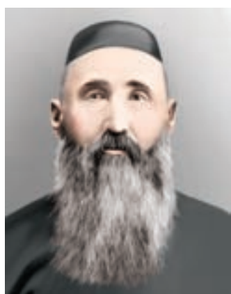
ШӘКӘРІМ ҚҰДАЙБЕРДІҰЛЫ (1858–1931)

Шәкәрім Құдайбердіұлы 1858 жылы қазіргі Шығыс Қазақстан облысы (бұрынғы Семей облысы) Абай ауданында дүниеге келген.