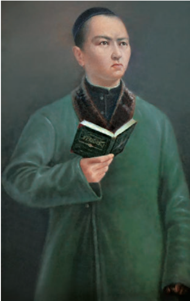
Ә. Қастеев. «Жас Абай». 1945 жыл.

1-тапсырма. Өнер туындысына қараңдар. Оның бет бейнесінен, көзқарасынан нені аңғаруға болады?