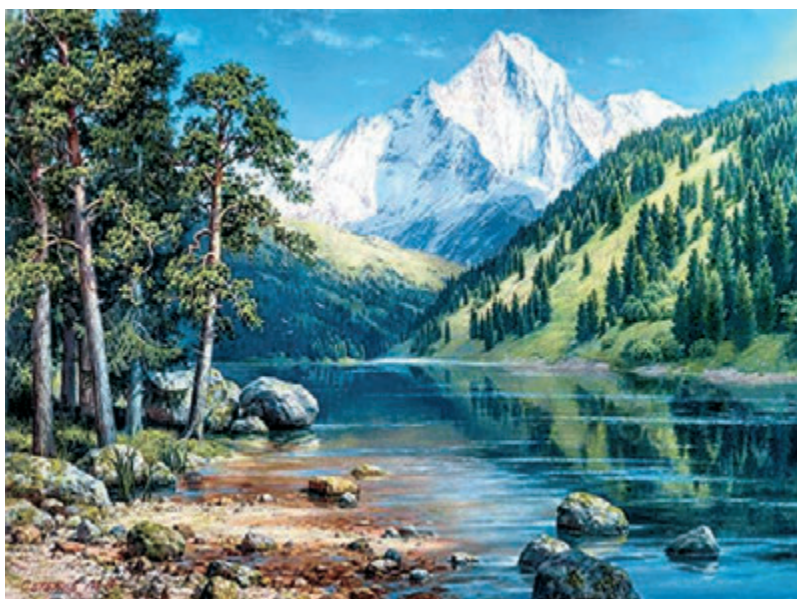
М.Сатаров. Марқакөл көлі.

5-тапсырма. Өнер туындыларына қараңдар. Суретшілер шығармаларында өз сүйіспеншіліктерін қалай білдірген? Өңгімелеп беріңдер.