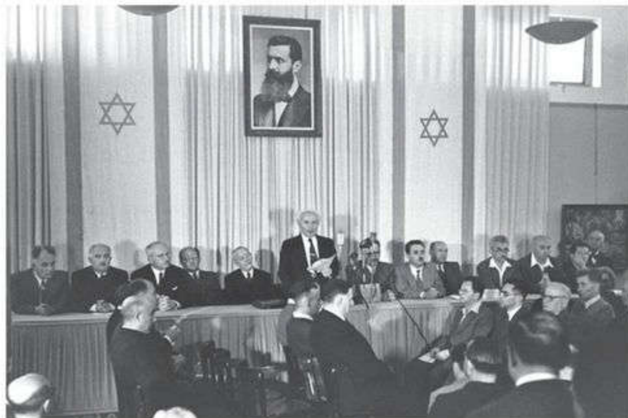
Давид Бен-Гурион провозглашает создание независимого еврейского государства

14 мая 1948 г. еврейский Национальный совет провозгласил создание Государства Израиль, со стороны арабского населения в данном регионе провозглашение своего государства не состоялось. Более того, в Палестине началась гражданская война. Израиль за-