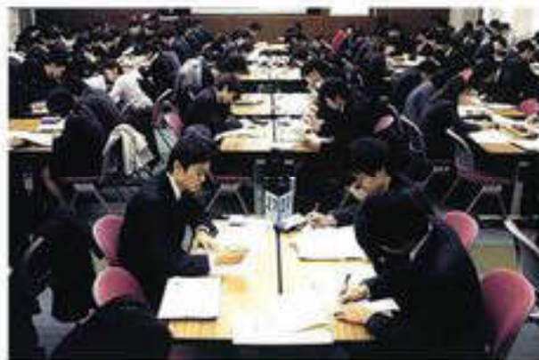
Обучение в Японии

Аналогичная тенденция наблюдалась и продолжаетея в других развитых и новых индустриальных странах. По этой причине образование становится там одним из жизненных приоритетов. Так, в конце XX столетия в Японии и Южной Корее почти все молодые граждане посещали школу, в то время как в Индонезии — 45—50%, Таиланде — менее 40%.