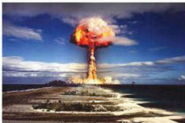
29 августа 1949 г. в Семипалатинске на специальном полигоне было проведено первое в СССР испытание ядерного оружия

сторонника и каждая из стран пыталась одержать верх над противником в области вооруженных сил. Для этого конструировалось и производилось огромное количество оружия.