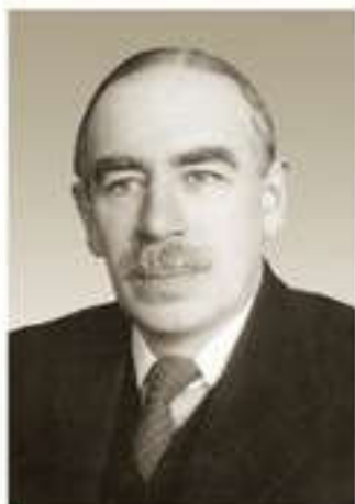
Джон Кейнс, английский экономист, основатель кейнсианского направления в экономической теории

стабильный рост экономических показателей. Кроме того, государство должно было регулировать подоходный налог, определять пособия по безработице и средства социального страхования. Эта модель государственного развития получила название “государство благосостояния”.