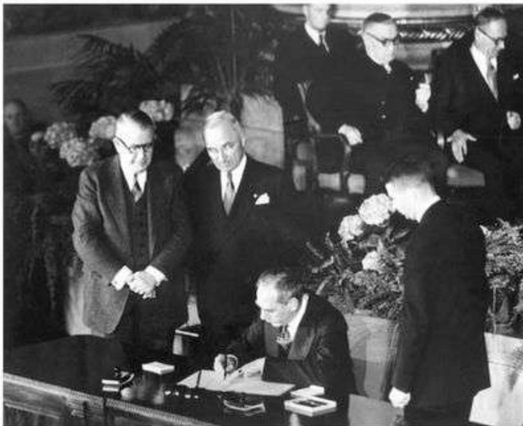
Образование НАТО. Министр иностранных дел США подписывает Североатлантический договор, 4 апреля 1949 г.

В Западную Европу была завезена масса американского вооружения.