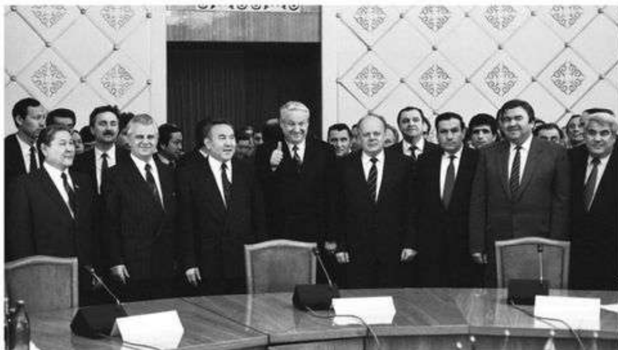
Алма-Атинская декларация об образовании СНГ

7 и 8 декабря 1991 г. главами Беларуси, Российской Федерации и Украины было учреждено Содружество Независимых Государств (СНГ). В результате распада СССР 16 декабря 1991 г. образовалась независимая и суверенная Республика Казахстан. 21 декабря 1991 г. в Алма-Ате (ныне Алматы) руководители 11 из 15 бывших союзных республик подписали Протокол к Соглашению, в котором говорилось, что эти страны образуют СНГ. Участники встречи подписали также Алма-Атинскую декларацию, в которой подтвердили основные цели и принципы СНГ. В состав СНГ не вошли государства Балтии (Эстония, Латвия, Литва) и Грузия.