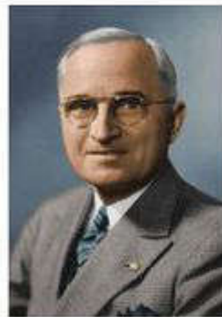
Гарри Трумэн, 33-й президент США

Доктрина Трумэна касалась не только Греции и Турции. По существу, она носила мировой характер. В ней прямо указывалось, что политика Соединенных Штатов должна состоять в поддержке всех народов, борющихся против коммунизма.