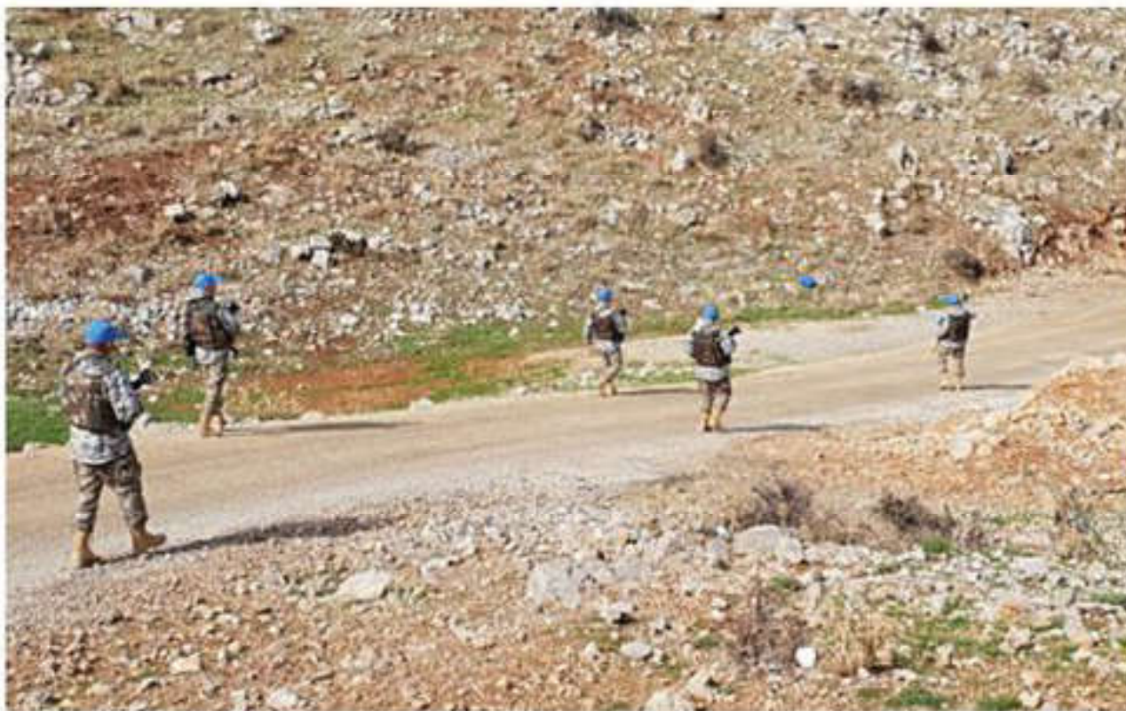
Миротворцы Казахстана патрулируют территорию в Ливане

К началу нового века ООН имела не только положительный багаж миротворческой деятельности, но и негативный опыт. ООН не всегда справлялась с взятыми на себя обязанностями.