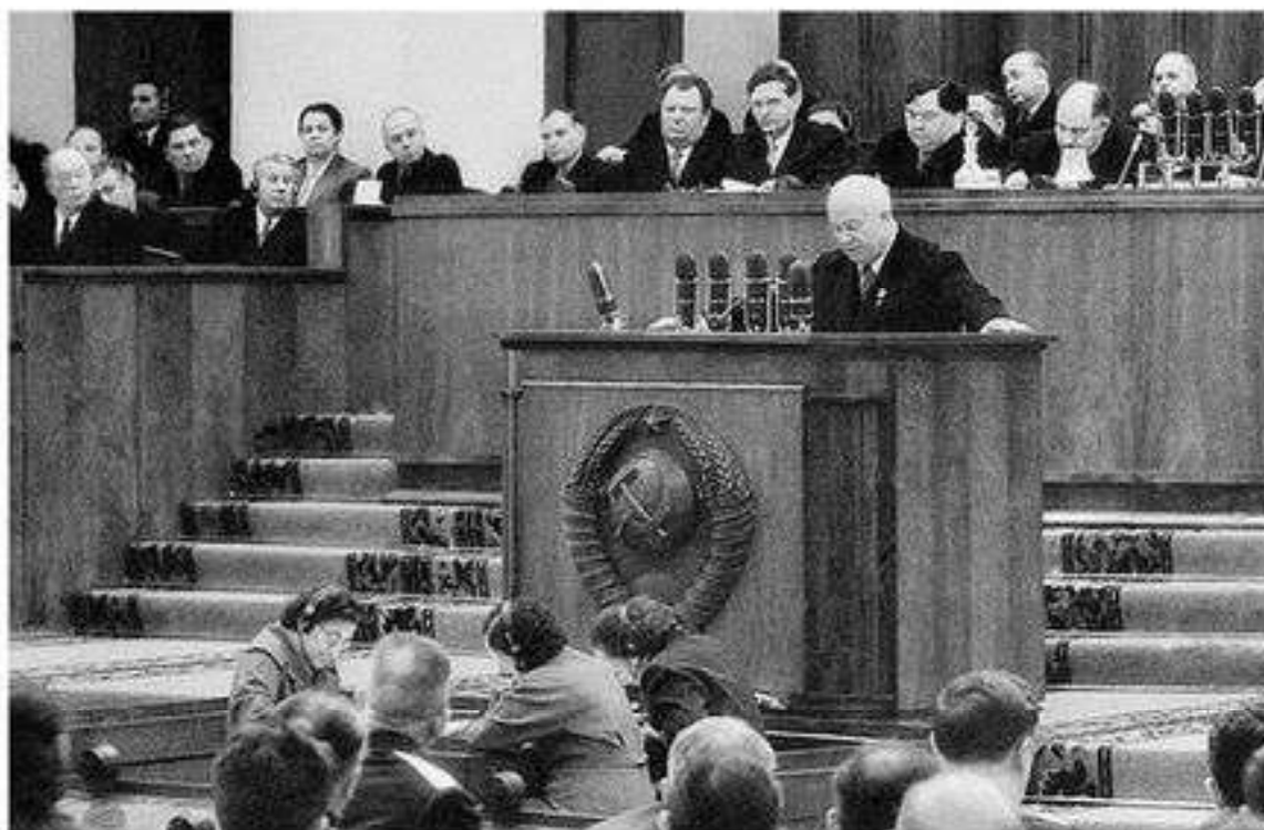
XX съезд КПСС, Февраль 1956 г.

Хрущевская оттепель. После смерти Сталина 5 марта 1953 г. в стране началась борьба за власть, в результате которой во главе страны встал Н. С. Хрущев.