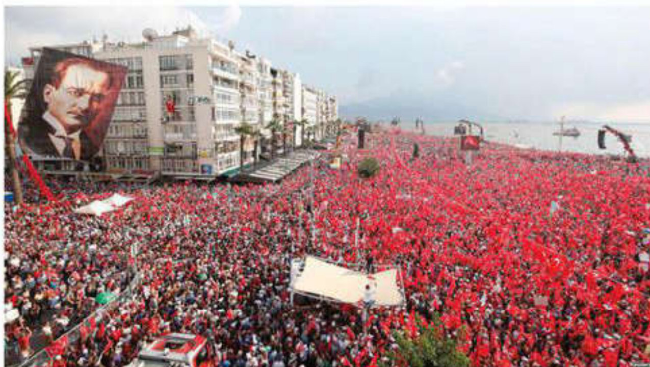
Кемализм в Турции

В ноябре 1945 г. И. Иненю, выступая в парламенте, впервые высказался за отказ от однопартийной диктатуры. В январе 1946 г. группа вышедших из НРП депутатов провозгласила создание Демократической партии (ДП). Ее возглавлял Джелаль Баяр и Аднан Мендерес. В отличие от НРП, новая партия выступила за соблюдение демократии и гражданских свобод, за большую свободу