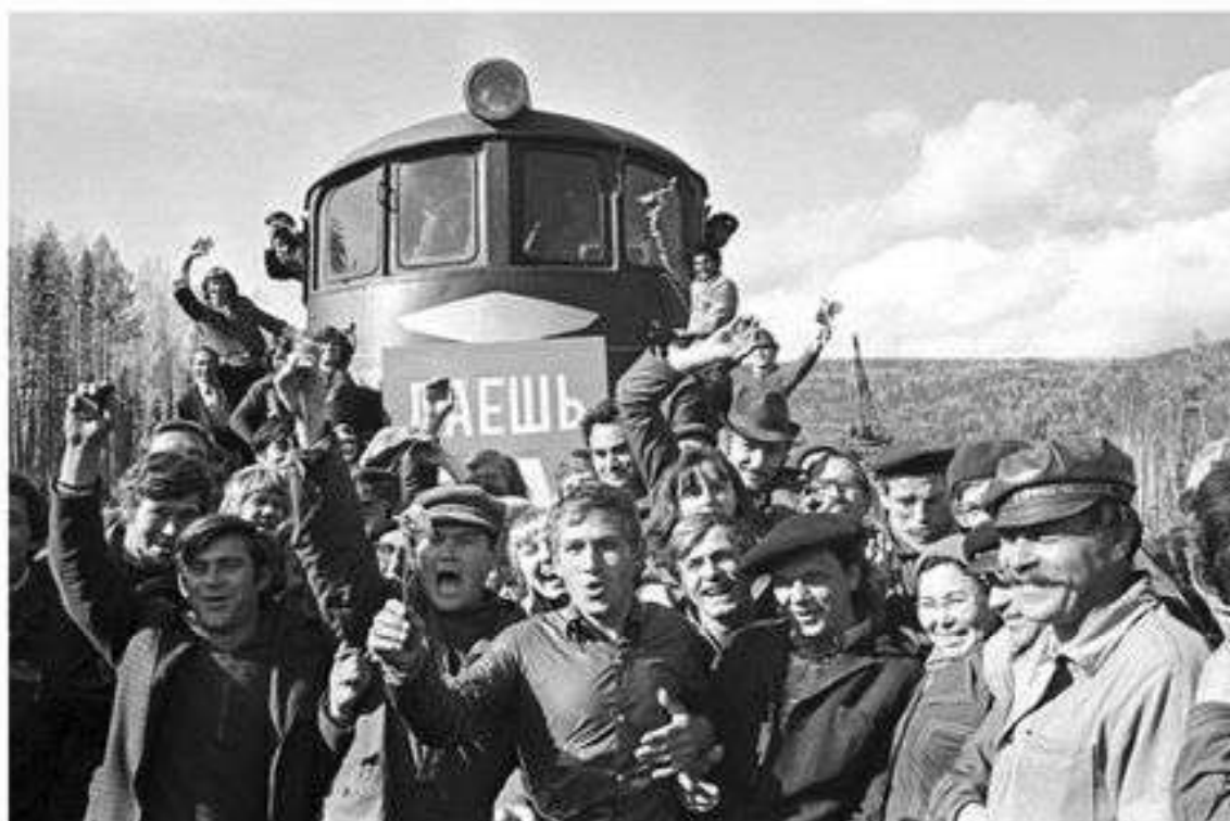
Строительство БАМа, 1975 г.

Период между приходом к власти Л. И. Брежнева в середине 60-х годов и началом перестройки в 80-х вошел в историю как период застоя.