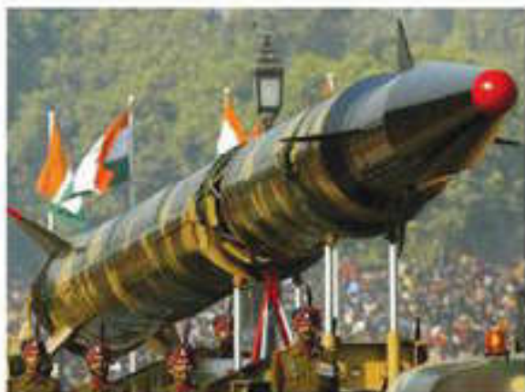
Ядерное вооружение Индии

Индия вышла на второе место в мире по производству пшеницы; она обогнала США, уступив лавры первенства только Китаю). В городе и деревне возник довольно крепкий средний класс. Смешанная экономика с крупным государственным сектором способствовала формированию относительно развитой инфраструктуры. Расширились торгово-экономические, научно-технические связи Индии со многими странами