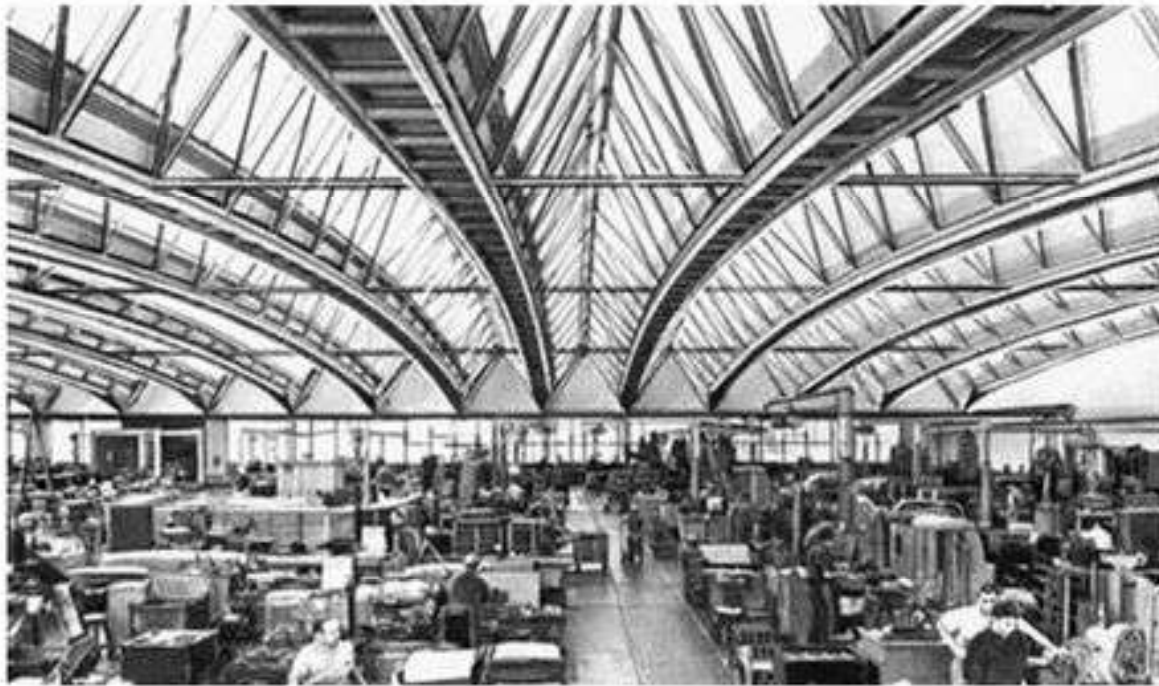
Машиностроительный завод в Мюнхене, ФРГ

Немецкое “экономическое чудо” было обусловлено следующими факторами: восстановление и реконструкция промышленности происходили на новой технической основе; создавалась высокая концентрация производства и капитала; внедрение новейших технологий сочеталось с традиционно высокой работоспособностью немецкого населения. Немалую роль сыграло отсутствие военных расходов и отсутствие затрат на содержание колониального управления.