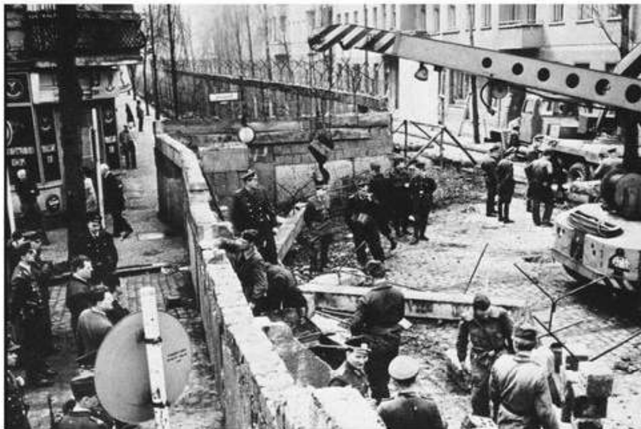
Строительство Берлинской стены

Внутри самого ОВД помимо Берлинского были и другие кризисы, вызванные стремлением социалистических стран Восточной Европы к освобождению от советского влияния. В 1956 г. вооруженное вмешательство сил ОВД в Венгрии ликвидировало вооруженное восстание против социалистического правительства страны. В 1968 г. страны — члены ОВД направили свои войска в Чехословакию, чтобы остановить демократический процесс в чехословацком обществе.