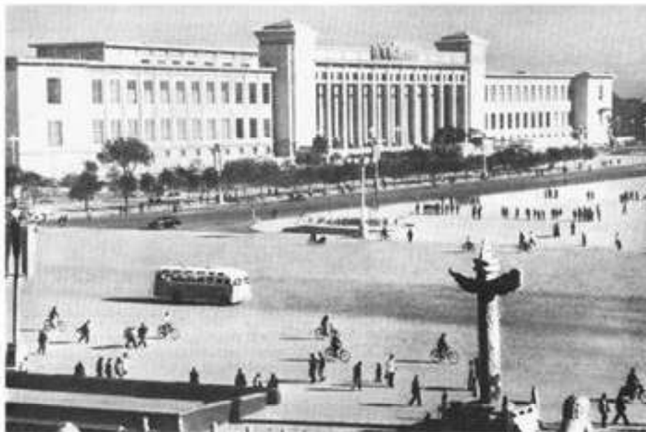
Пекин. Дом Всекитайского собрания народных представителей. 1958—1959 гг. Общий вид. План

Образование КНР. Китай в 50—60-х годах. 1 октября 1949 г. в Пекине официально было провозглашено образование Китайской Народной Республики (КНР). Создано Центральное народное правительство, в руки которого официально передавалась власть в стране.