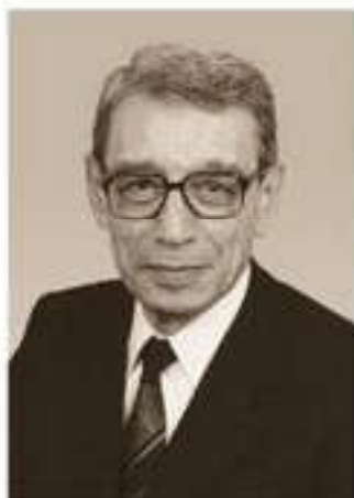
Б. Бутрос-Гали, Генеральный секретарь ООН с 1992 по 1996 г.

ях по предупреждению конфликтов. Различные международные и региональные организации, государства и негосударственные организации объединяют свои усилия для борьбы с распространением смертоносных конфликтов. Однако разнообразие мандатов, соответствующие национальные интересы и противоречивые взгляды на предотвращение конфликтов и гуманитарную деятельность ограничивают их эффективную деятельность.