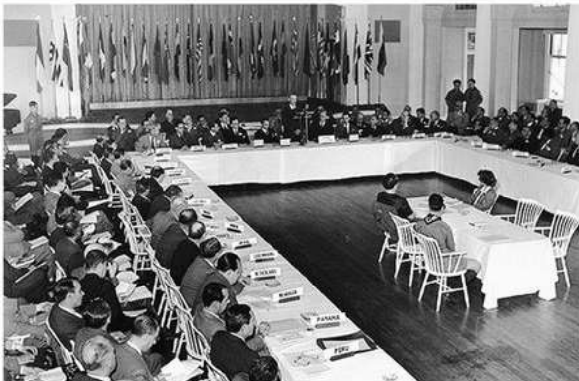
Конференция в Бреттон-Вудсе. 1—22 июля 1944 г.

еще одной предпосылкой осуществления модели “государства благосостояния”. В 1947 г. 23 индустриальных государства подписали Генеральное соглашение о торговле и тарифах (ГАТТ), которое положило начало переговорам и соглашениям о сокращении пошлин и либерализации торговли. Затем последовали новые переговоры. Их последний раунд завершился в 1995 г. созданием вместо ГАТТ Всемирной торговой организации (ВТО), в которую в настоящее время входит большинство стран мира.