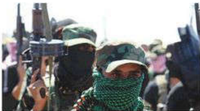
Международный терроризм — угроза всему человечеству

В период до Второй мировой войны террористические