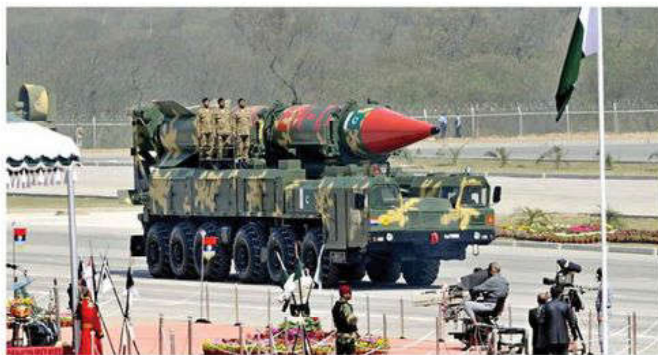
С 1988 г. Пакистан официально вошел в число участников клуба ядерных держав

Успехи Индии в социально-экономическом развитии за годы независимости. За годы независимости Индия добилась крупных успехов в социально-экономическом развитии. Она вошла в первую десятку стран мира по объему промышленного производства, создала мощный научно-технический потенциал, включая космические и ядерные исследования, подготовила квалифицированные кадры ученых, специалистов, инженеров, рабочих. Несмотря на высокую степень государственного регулирования, частный сектор в стране стал важной частью экономики. Втрое вырос сбор зерна (в 1995 г.