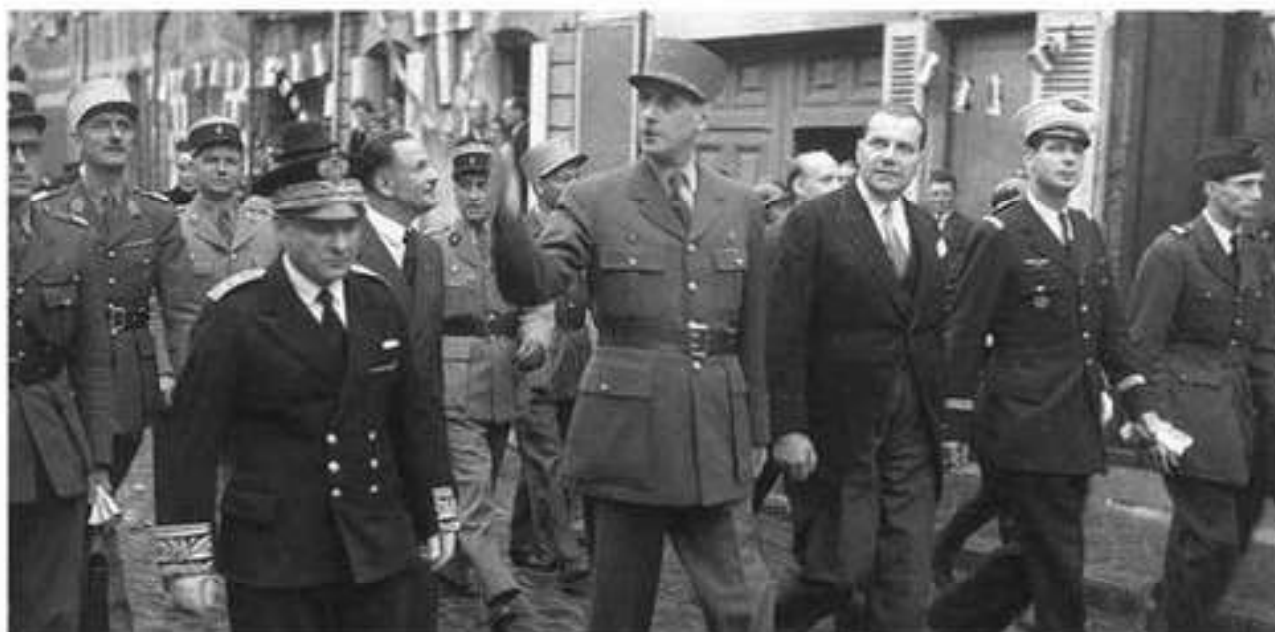
Шарль де Голль и его сторонники на улицах Парижа

приняли второе решение, и было избрано Учредительное собрание, в котором ведущие позиции имели три партии — Французская коммунистическая партия (ФКП), Социалистическая партия (СФИО) и партия Народного республиканского движения (МРП).