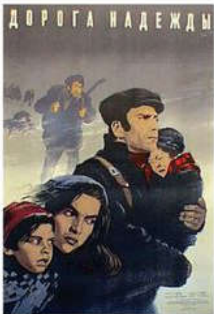
Афиша к фильму "Дорога надежды"

ния и мужество участников итальянского Сопротивления. Затем в Италии появился еще целый ряд неореалистических фильмов, получивших высокую оценку: "Похитители велосипедов" (режиссер В. де Сика), "Дорога надежды" (режиссер П. Джерми), "Земля дрожит" (режиссер Л. Висконти), "Нет мира под оливами" (режиссер Дж. де Сантес) и др.