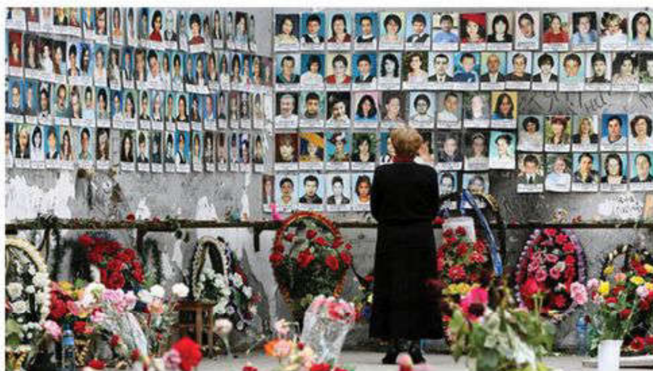
Последствия теракта в Беслане

Таким образом, реальностью сегодняшнего дня является широкомасштабное совершение террористических актов, хотя и не име-