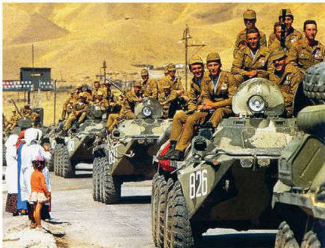
Ввод советских войск в Афганистан.

В марте 1983 г. президент США Р. Рейган выступил со стратегической оборонной инициативой (СОИ). Осуществление этой программы “звездных войн” означало бы подрыв всей системы соглашений о предотвращении ядерной войны.