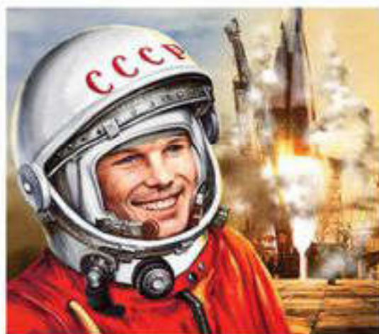
Юрий Гагарин, совершивший первый полет в космос

На основе научных разработок и их внедрения в производство уже в первые послевоенные годы была создана новая материальная база для массового производства товаров длительного пользования (автомобили, холодильники, телевизоры, радиоаппаратура, другая бытовая техника). В 70—80-х годах началась новая фаза научно-технической революции . Ее