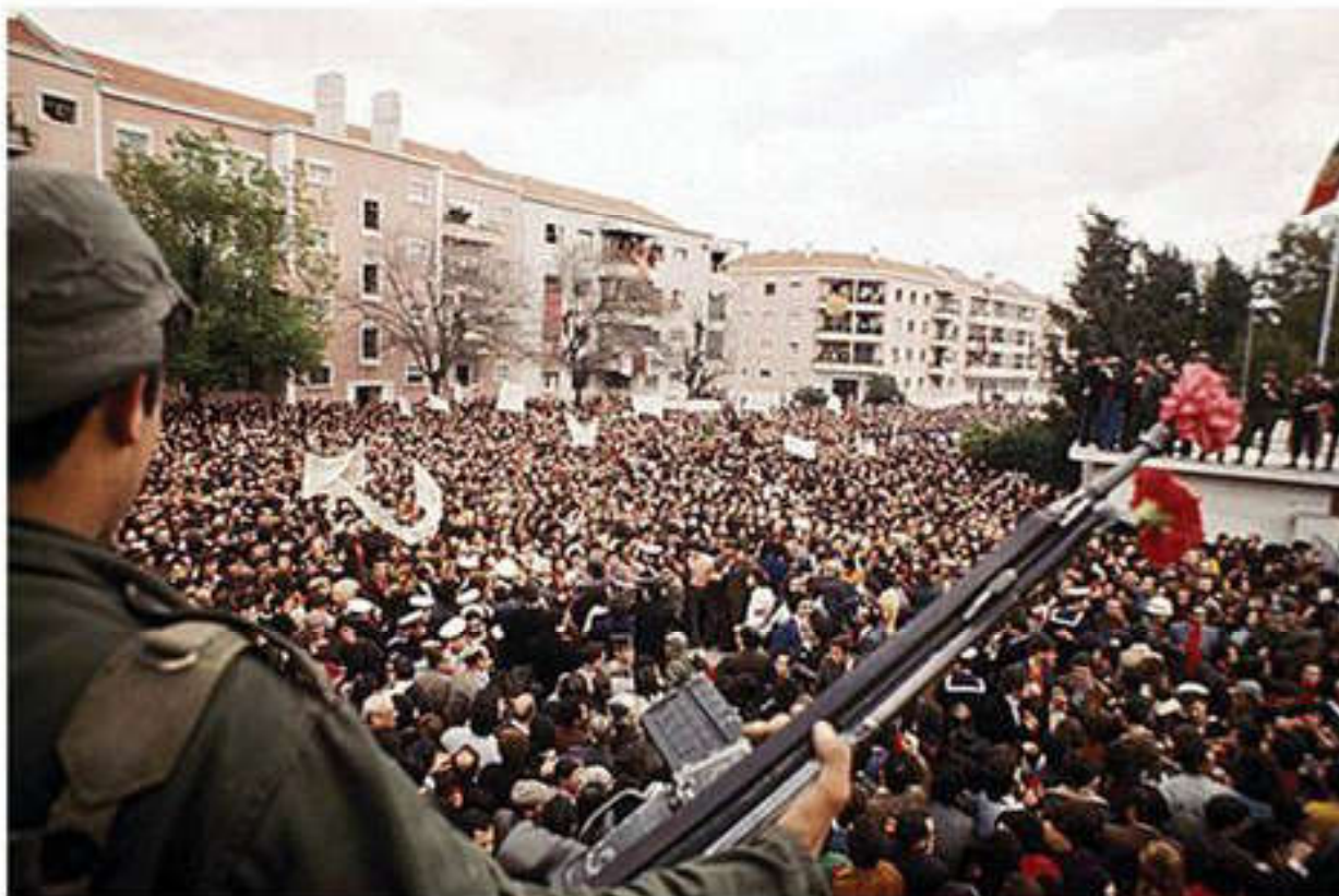
Португалия. "Революция гвоздик", апрель 1974 г.

Выбор оказался небольшим: социалистический путь, социалистическая ориентация или капиталистический путь. При любом варианте определяющими оказываются культурно-цивилизационные особенности и традиции.