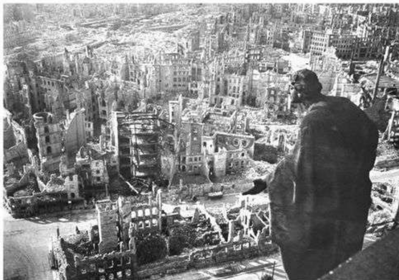
Германия после войны

Современная модель социальной защиты Германии сформировалась под влиянием перемен, произошедших в стране в 50—60-х годах XX в., и изменялась в результате прихода к власти каждой новой партии.