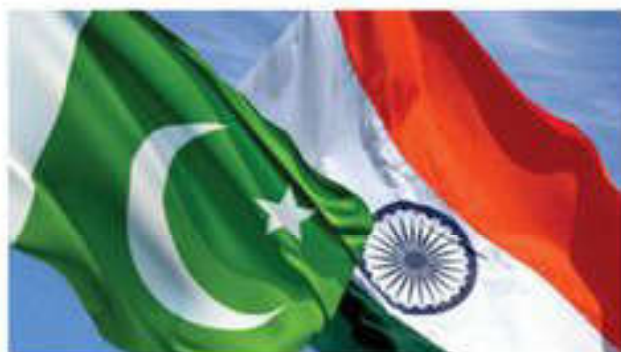
Флаги Пакистана и Индии

В 1956 г. Учредительное собрание утвердило конституцию. Пакистан был объявлен Исламской Республикой. В отличие от Индии в Пакистане введена президентская форма правления. Правительство возглавляет премьер-министр. Обе палаты парламента имеют ограниченные полномочия. После переворота 1958 г. тенденция к ограничению представительных органов власти усилилась. В 1962 г. была введена новая конституция. В 1977 г. избранное прав-