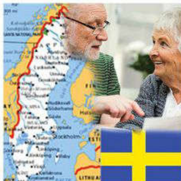
«Шведская модель» социализма

Наконец, в самом широком смысле «шведская модель» представляет собой комплекс социально-экономических и политических