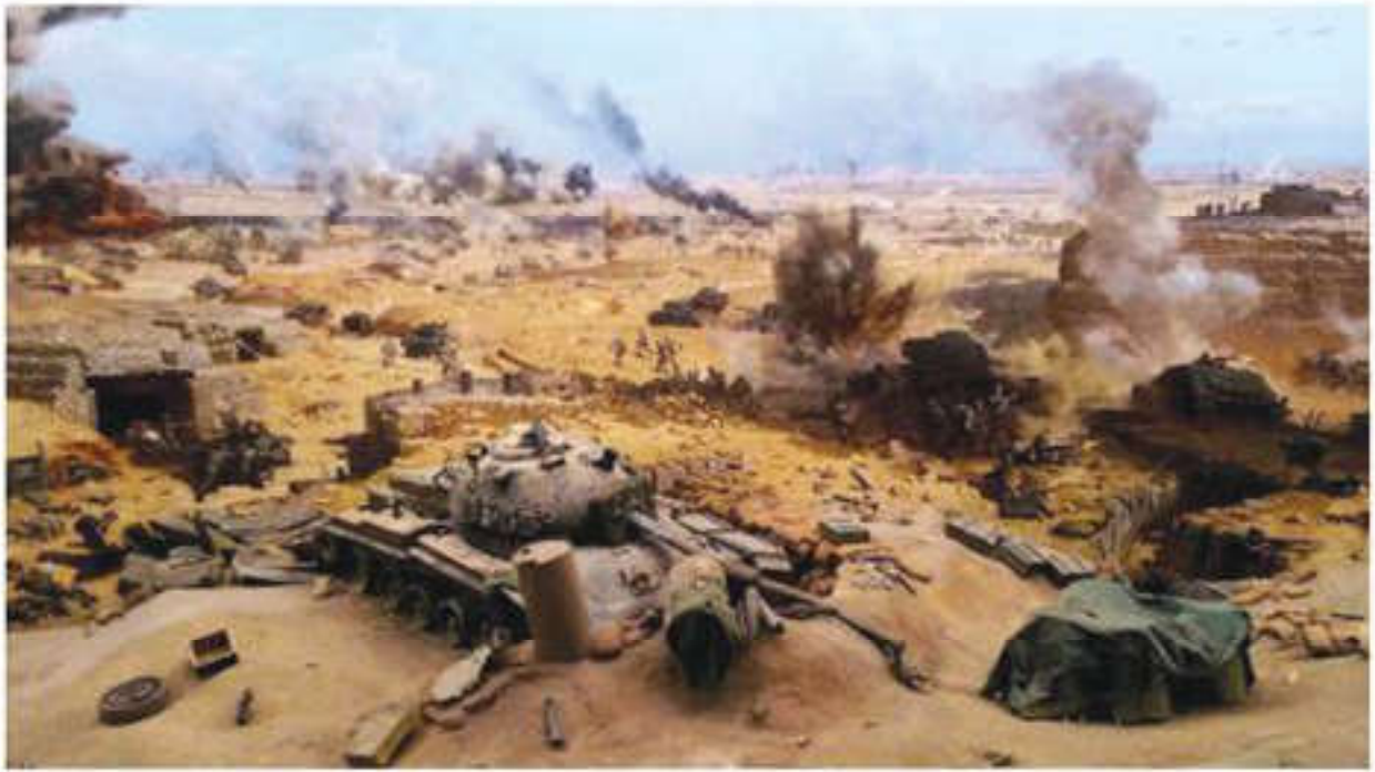
Арабо-израильская война 1973 г.

5 июня 1967 г. Египет, Сирия и Иордания стянули свои войска к границам Израиля, изгнали миротворцев ООН и заблокировали вход израильским кораблям в Красное море и Суэцкий канал. Израиль оккупировал Западный берег и Голанские высоты, приобрел весь Синайский полуостров, и теперь весь Иерусалим принадлежал Израилю.