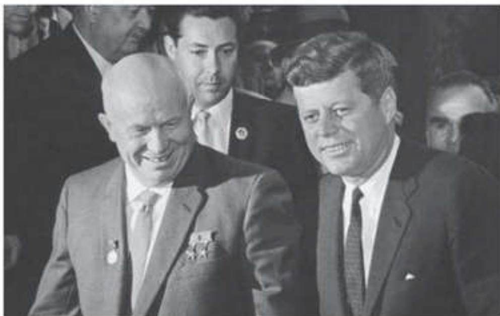
Советский лидер Никита Хрущев и президент США Джон Кеннеди на переговорах «Восток — Запад»

Между президентом США Дж. Кеннеди и главой советского правительства Н. С. Хрущевым начались напряженные переговоры. После нескольких тревожных дней и ночей к 28 октября между ними была достигнута договоренность об условиях мирного урегулирования кризиса. Советский Союз согласился вывести ракеты среднего радиуса действия с Кубы, а США — отменить «карантин» и дать обязательство уважать неприкосновенность границ Кубы. Кроме того, США отказались от размещения своих ракет в Турции у границ СССР. Мирное решение Карибского кризиса с учетом взаимных интересов устранило огромную опасность и создало важный прецедент в поисках путей к разрядке международной напряженности.