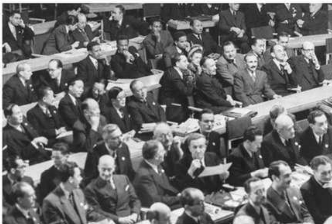
Первое заседание Генеральной Ассамблеи ООН. Лондон, 1946 г.

обязательные для членов ООН. Совет Безопасности состоит из пяти постоянных и десяти непостоянных членов. Постоянными членами являлись пять великих держав: СССР (затем Россия), США, Великобритания, Китай, Франция. Непостоянные члены избираются в совет в соответствии с процедурой, предусмотренной уставом.