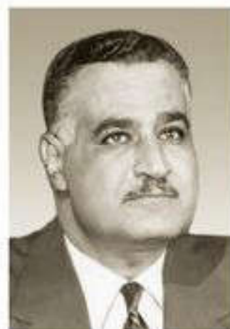
Гамаль Абдель Насер

Отсутствие среди арабских стран согласованных действий стало причиной их поражения в так называемой Шестидневной войне 1967 г.