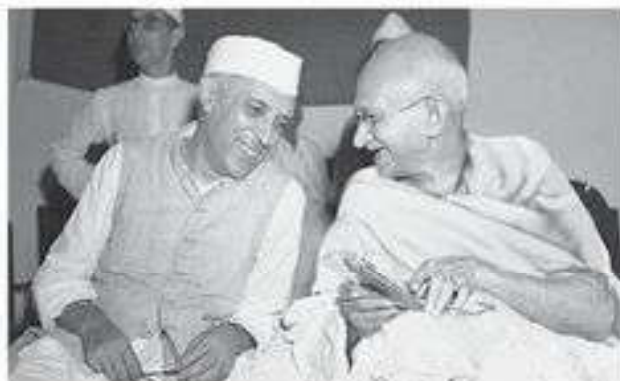
Джавахарлал Неру и Махатма Ганди

Одновременно произошло несколько крупных религиозно-этнических столкновений. В одном из них, 16 августа 1946 г. в Калькутте, погибли тысячи человек. А в начале 1947 г. правительство провинции Пенджаб ушло в отставку на фоне конфликтов между индуистами, мусульманами и сикхами. Новому и одновременно последнему британскому наместнику Луису Маунтбеттену стало ясно, что дальше сохранять иллюзию единого индийского государства невозможно. Это мнение утвердилось и в ИНК, несмотря на