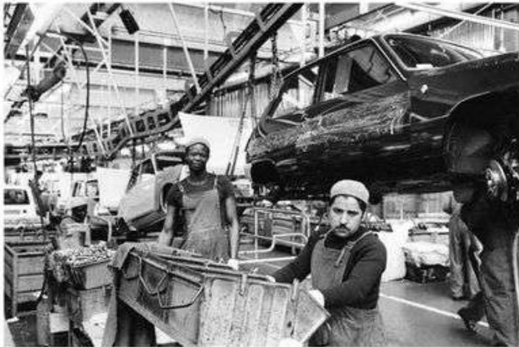
Мигранты на заводе Renault

Франция. Вторая мировая война глубоко потрясла экономическую систему Франции. Третья республика, существовавшая с 1875 г., была ликвидирована. В ходе войны начался распад ее колониальной империи.