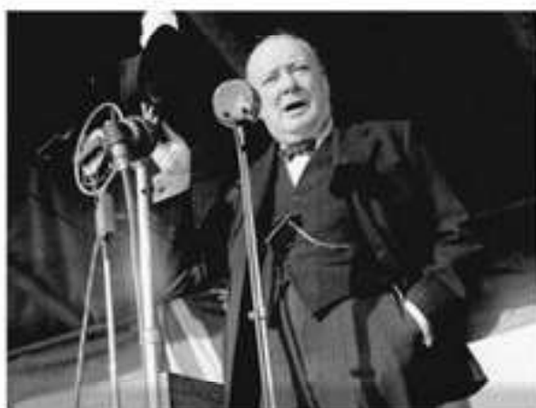
Уинстон Черчилль произносит знаменитую Фултонскую речь. 5 марта 1946 г.

Основная цель выступления У. Черчилля — установление влияния Запада по всему миру. В своей речи он прославлял мощь США как страны, находящейся на вершине мировой силы. Он обвинил