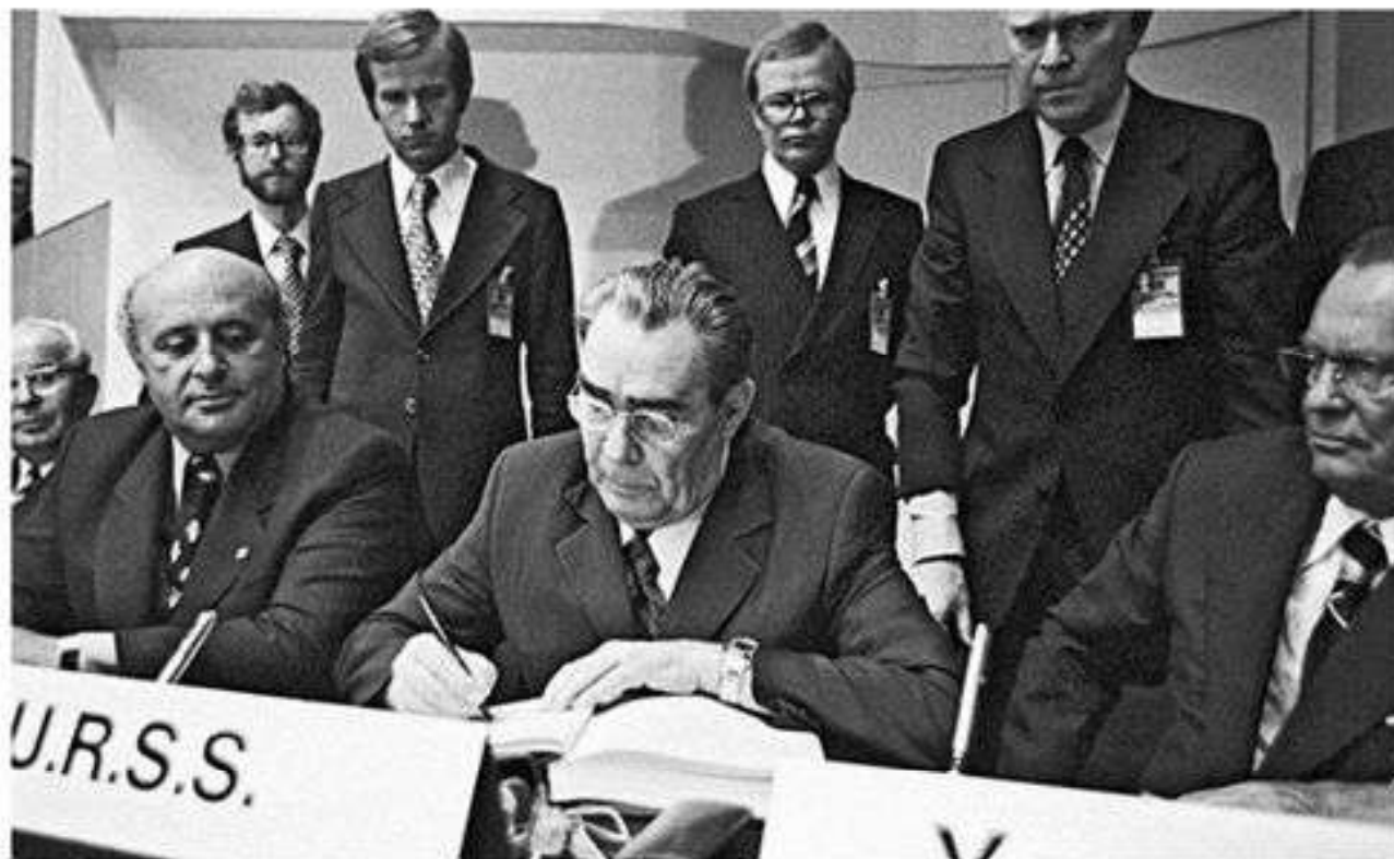
Л. И. Брежнев подписывает Заключительный акт Совещания по безопасности и сотрудничеству в Европе. Хельсинки, 1975 г.

В рамках дальнейших шагов прошли встречи СБСЕ в Белграде (1977—1978), Мадриде (1980—1983), которые не привели к серьезным договоренностям. Затем в ходе встречи в Вене (1986—1989) было принято решение продолжить переговоры о мерах доверия в области безопасности.