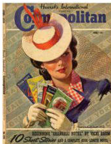
Глянцевые журналы — важный продукт и жанр массовой культуры

В отличие от высокой культуры, которая возвышает человека и приобщает