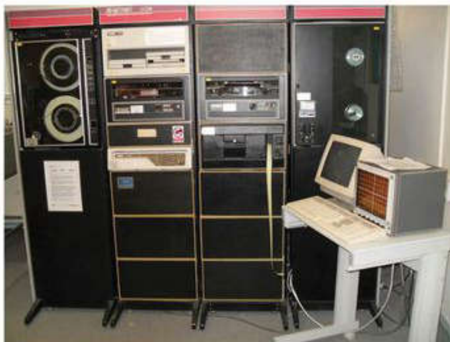
Зарождение компьютерной индустрии

цветными телевизорами семей в западноевропейских странах превысил 85%, а в США — 94%.