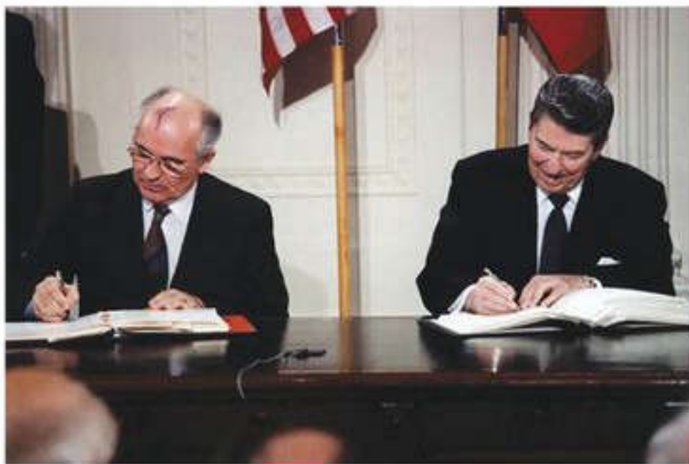
Генеральный секретарь ЦК КПСС Михаил Горбачев и президент США Рональд Рейган подписывают договор в Белом доме, 1987 г.

Немаловажное значение имело подписание двустороннего договора об ограничении и сокращении стратегических наступательных вооружений.