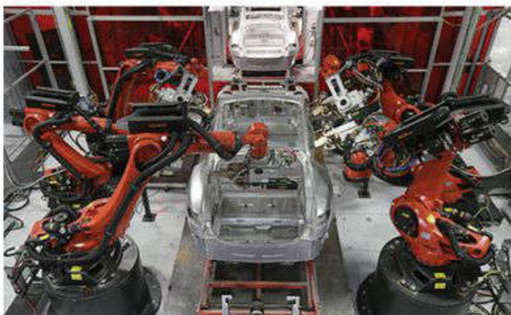
Использование роботов-помощников на заводе

4. НТР влияет на отраслевую структуру материального производства, при этом в ней резко увеличивается доля промышленности, так как от нее зависит рост производительности труда в других отраслях хозяйства. Сельское же хозяйство в эпоху НТР приобретает индустриальный характер. Среди отраслей промышленности стали выделяться химическая, электроэнергетика, от которой в первую очередь зависит научно-технический прогресс, и машиностроение.