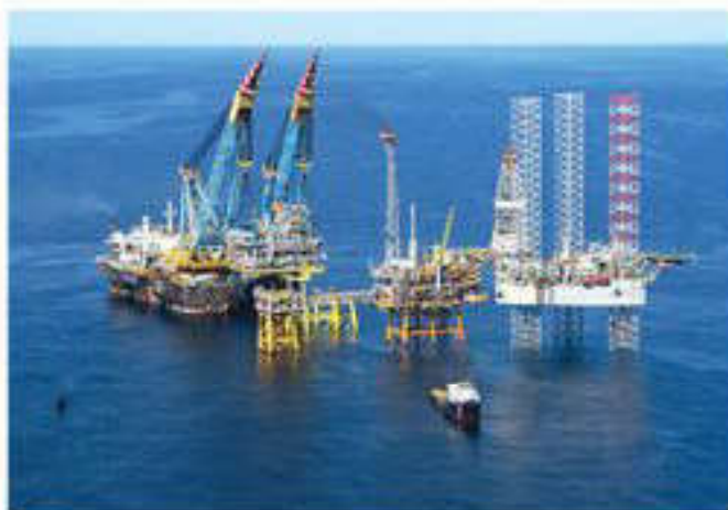
Нефтегазовая промышленность ОАЭ

Монокультурная экономика — экономика, в которой господствует производство одного вида продукта (обычно сельскохозяйственного). При ограниченном национальном производстве странам приходится