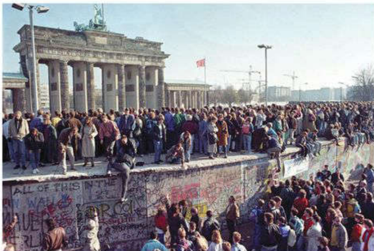
Падение Берлинской стены

В условиях глобализации все большее значение приобретают экономический регионализм, интеграционные объединения в Европе,