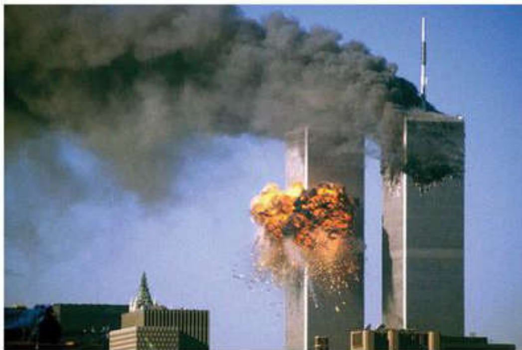
Террористический акт 11 сентября 2001 г. в Нью-Йорке

Серия терактов была проведена в метро. В Мадриде в марте 2003 г., когда произошли четыре взрыва в вагонах электропоездов,