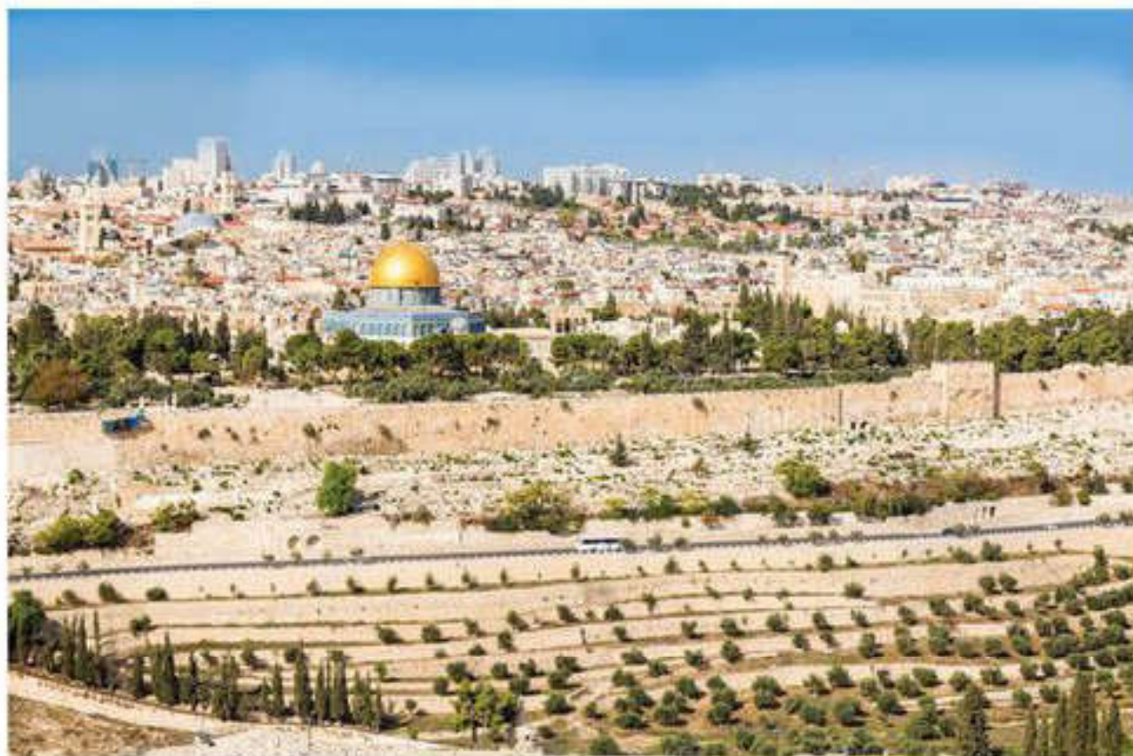
Панорама Старого города Иерусалима на Храмовой горе

Палестинское арабское государство так и не было образовано. Арабские государства продолжали считать себя находящимися в со-