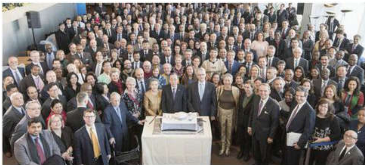
70-летие первого заседания Генеральной Ассамблеи ООН. Нью-Йорк, 2016 г.

Серьезной проблемой для человечества и, естественно, для ООН являются конфликты. За последние десятилетия число внутренних конфликтов значительно увеличилось. Страшно то, что 90% пострадавших в ходе конфликтов были мирные жители. Помимо