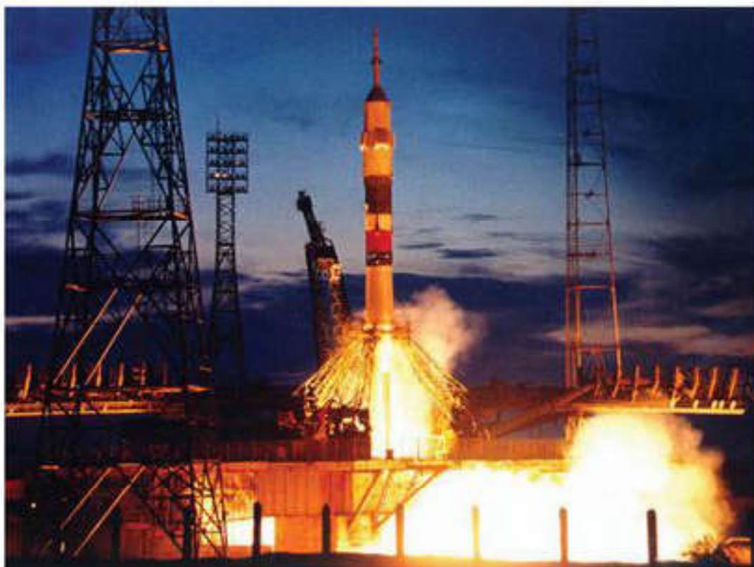
Запуск ракеты с космодрома Байконур

Развитие системы образования. Роль образования в повышении конкурентоспособности общества. Знания в современном обществе являются настоящим богатством, так как новый экономический мир основывается на образованности и способностях человека. Именно человек с его интеллектом и умениями все с большей очевидностью становится главной движущей силой в политическом развитии мира. Поэтому развитие системы образования является важнейшей сферой деятельности государства, что обеспечивает его будущее. Подобно тому как в свое время экономический фактор потеснил военный, сегодня развитие человеческого потенциала выходит на передний план, опережая другие приоритеты. И это понятно: человек вносит решающий вклад в современное производство, экономику, культуру, науку.