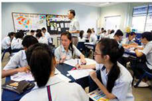
Обучение в Сингапуре