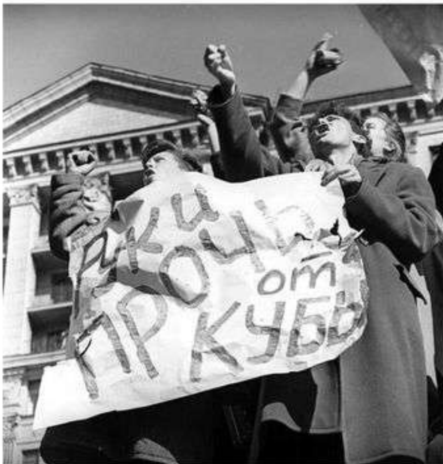
Пикет в Москве во время Карибского кризиса. 1962 г.

кубинских контрреволюционеров Куба приняла дополнительные меры к укреплению своей обороны при содействии Советского Союза. По тайному соглашению с Кубой СССР осенью 1962 г. разместил на ее территории свои ядерные ракеты среднего радиуса действия. Это был весьма опасный и непродуманный шаг советского правительства. Узнав об этом, США немедленно предприняли жесткие ответные меры. 22 октября 1962 г. президент Дж. Кеннеди объявил о введении "строгого карантина" на все виды оружия, перевозимого на Кубу, с досмотром судов других стран, следующих туда. Это означало фактически морскую и воздушную блокаду Кубы вооруженными силами США. Вокруг Кубы были сконцентрированы крупные американские военно-морские и военно-воздушные силы.