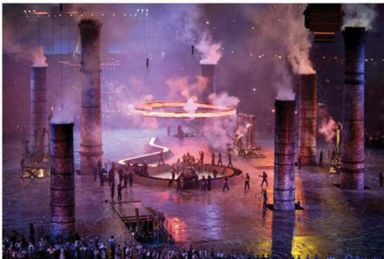
Заводы старой Англии на Олимпийском стадионе в Лондоне

динамичного развития было несколько. Несомненным толчком к нему стал план Маршалла.