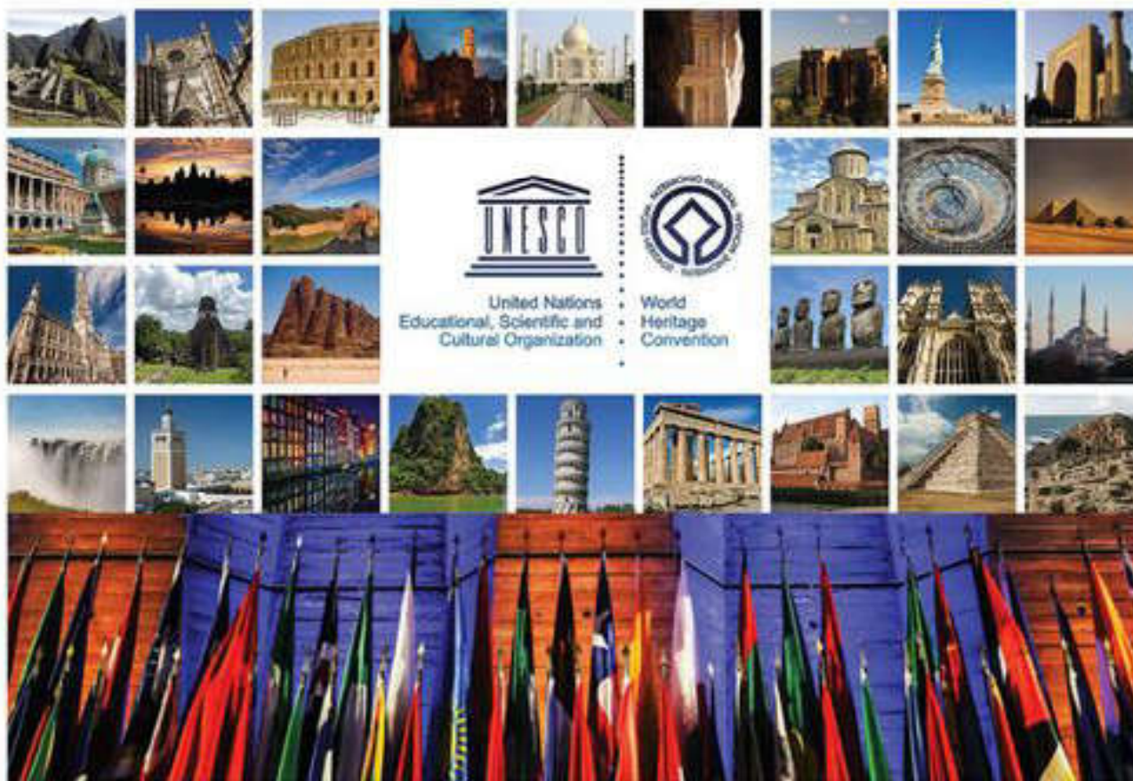
Некоторые объекты из Списка Всемирного наследия ЮНЕСКО

Миссия ЮНЕСКО состоит в содействии укреплению мира, искоренению нищеты, устойчивому развитию и межкультурному диалогу посредством образования, науки, культуры, коммуникации и информации.