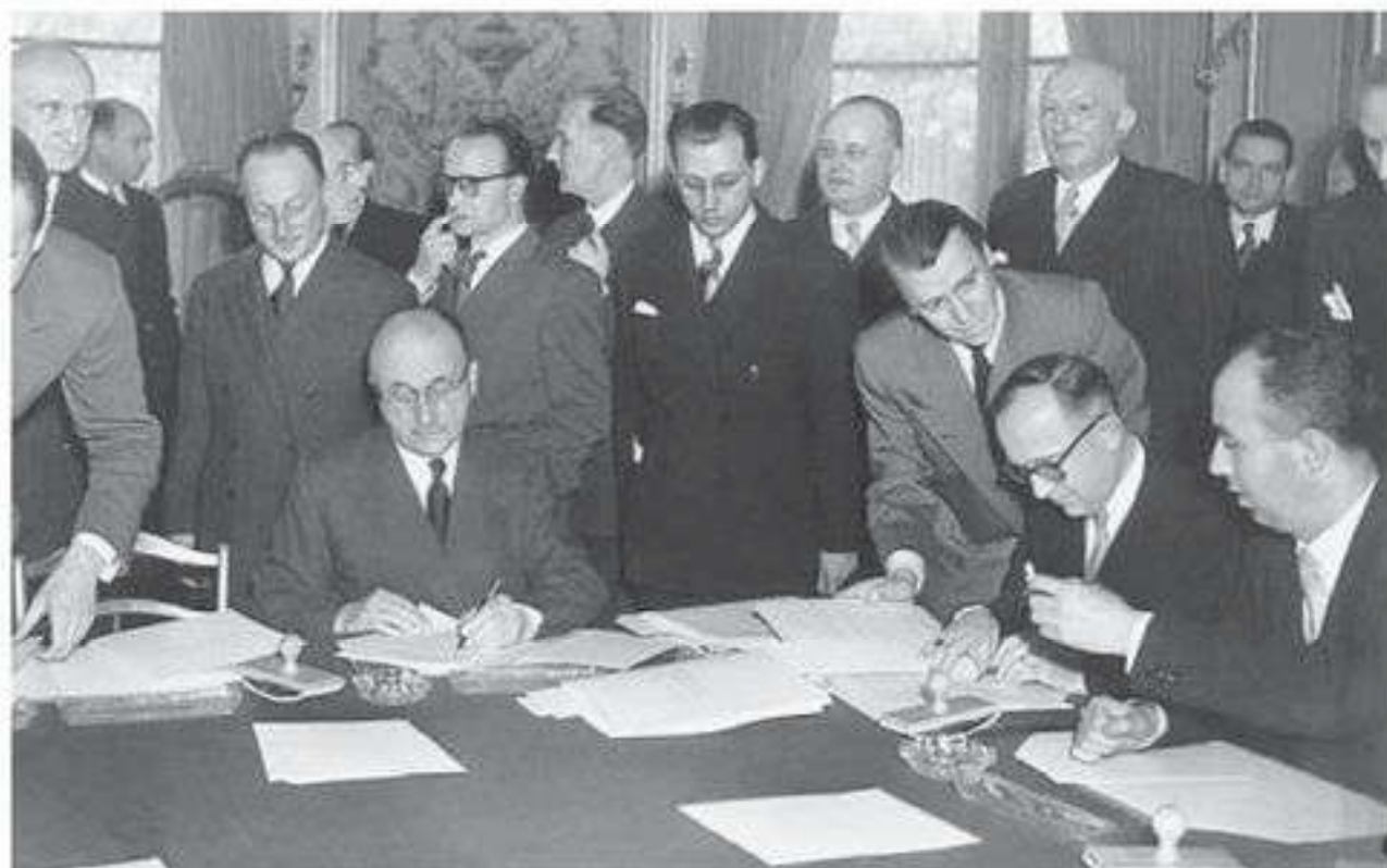
Подписание договора, учреждающего Европейское объединение угля и стали

стали шесть государств: Бельгия, Италия, Люксембург, Нидерланды, ФРГ, Франция.