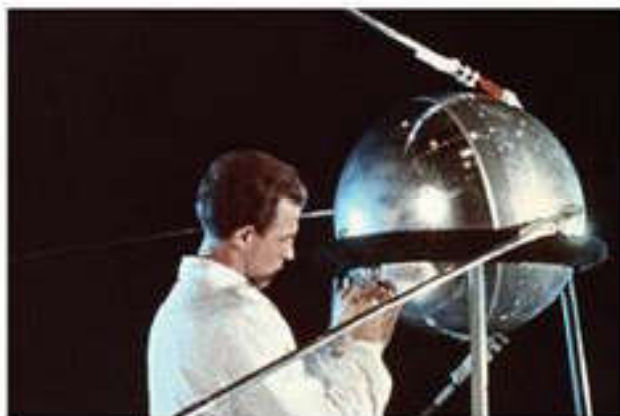
4 октября 1957 г. на орбиту был запущен "Спутник-1"

десятки и сотни раз повышающие частоту возникновения мутаций у самых разных организмов. Это позволило в последующие годы найти методы искусственного получения мутаций и с их помощью создать ценные сорта растений и штаммы микроорганизмов — продуцентов антибиотиков, аминокислот. На рубеже тысячелетий биологи научились конструировать искусственные генетические системы, вмешиваться в явления наследственности.