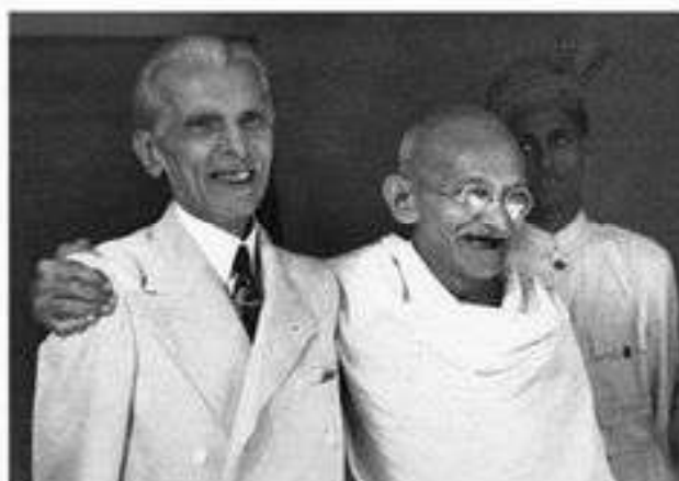
Мухаммад Али Джинна и Махатма Ганди

Проблема с образованием Пакистана заключалась в том, что было очень трудно провести границу между мусульманской и индуистской территориями. Англичане взяли на себя роль арбитров, но никакие усилия не могли обеспечить идеальный вариант. Граница