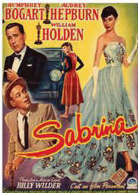
Афиша к фильму, снятому по классическому голливудскому канону: сильный герой, “эффект звезды”, счастливый конец

его к прекрасному, массовая культура расценивалась как продукт потребления, удовлетворяющий запросы толпы.