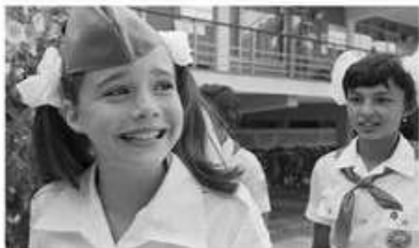
Американская школьница Саманта Смит в пионерском лагере "Артек", 1983 г.

Советское руководство приняло ряд жестких военно-силовых решений. Оно начало размещение на территории ГДР и ЧССР оперативно-тактических ракет повышенной дальности. Советско-американские отношения вели к росту недоверия и враждебности.