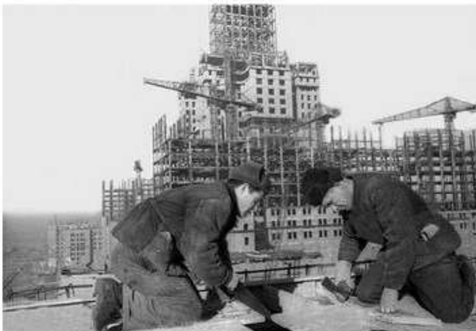
Восстановление СССР после войны

На северо-западных границах в соответствии с договором между СССР и Финляндией Союзу была передана область Печенга. В состав СССР по решению Потсдамской конференции вошла часть Восточной Пруссии с городом Кенигсбергом (ныне Калининград).