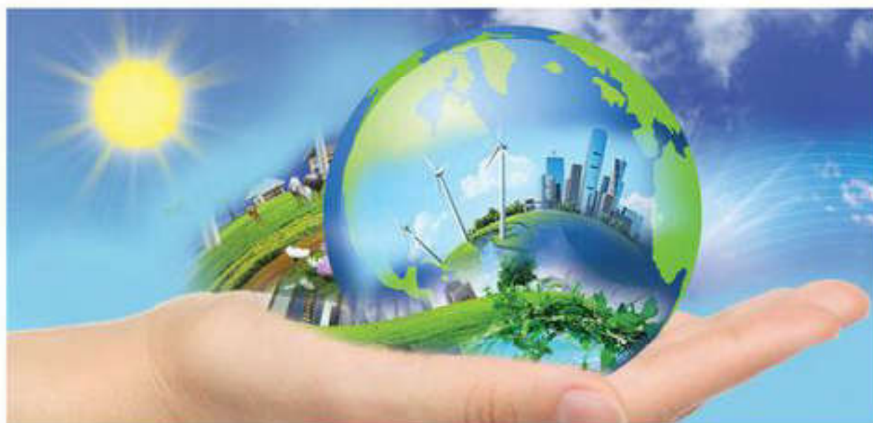
Одна из глобальных проблем — сохранение окружающей среды

Быстрый рост народонаселения в мире не сопровождается соответствующим увеличением производства продуктов питания и обеспечением необходимых условий существования больших масс