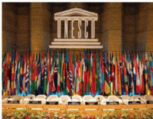
Қазіргі кезде дүниежүзілік мұра тізіміне 167 мемлекеттің нысандары енген

Дүниежүзілік мұра компеті жыл сайын сессиялар өткізеді, онда ерекше мәдени, тарихи немесе экологиялық маңыздылығына қарай сақтау мен насихаттауды талап ететін, басымдыққа ие табиғи