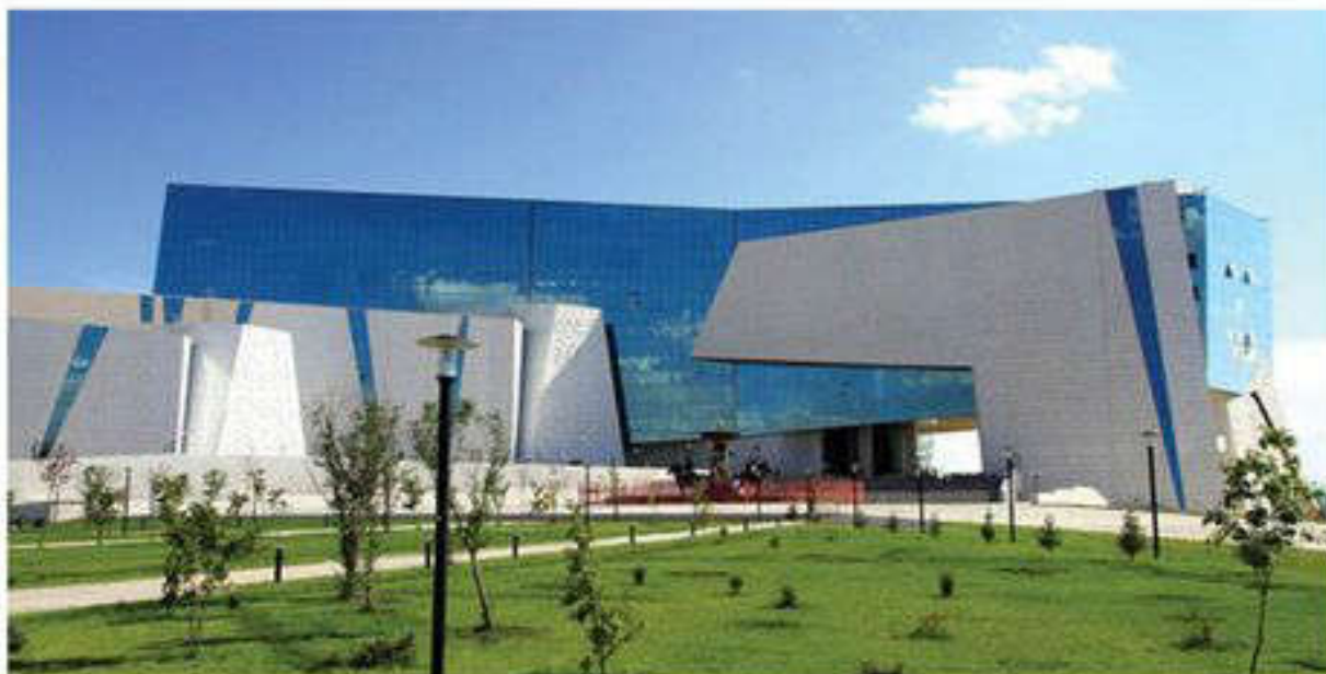
Қазақстан Республикасы Ұлттық мұражайы

заманауи жабдықтармен жарақталған. Мұражайда жалпы шолу және тақырыптық, интербелсенді сабақтар мен ойын түріндегі экскурсиялар әзірленеді. Ұлттық мұражай мәдениеттің заманауи танымдық мекемесі, Қазақстанның тарихи және мәдени мұрасын талдауға, салыстыруға, пайымдауға, талқылауға, пікірлер білдіру мен бағалауға арналған орын болып табылады.