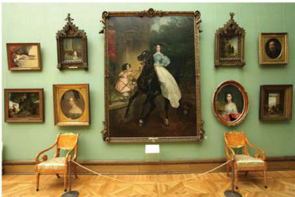
Третьяков галереясы – бейнелеу өнері мұражайы (Мәскеу)

Көптеген антикалық дәстүрлердің жанғыруы болған Қайта өрлеу дәуірінде мұражай ісінің дәстүрі де қалпына келтірілді. Мұражайлар зайырлық және діни билеушілердің жеке коллекцияларының негізінде пайда бола бастады.