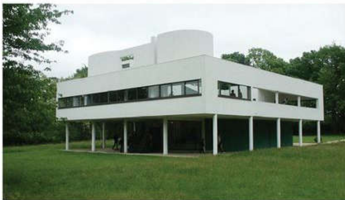
Ле Корбюзье. Тұрғын үй. (Пуризм)

Пуризм – 1910–1920 жылдардың сонындағы француз өнеріндегі ағым. Негізгі өкілдері – суретші А.Озанфан мен сәулетші Ш.Э.Жан-нере (Ле Корбюзье). 1910 жылдары авангардтық ағымдардағы декоративтік идеяларды жоққа шығарған пуристер, нақты геометриялық формаларды пайдалануға ұмтылды. Пуристер жұмысына тән ерекшеліктер болып кеңістік бейнесінің баяу ырғағы және біртектес заттардың (құмыра, стакан және т.б.) пішіндері саналады. Пуризмнің көркемдік