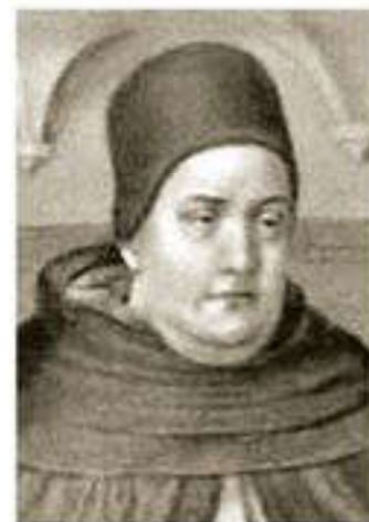
Фома Аквинский (1225–1274)

Мемлекет пайда болуында теологиялық теориядан патриархалдыға ауысу теориясы көне грек философы Платонға тиесілі. Платонның пікірінше, мемлекет Олимпиялық құдайлар дәуірінде пайда болып, олар әлемдегі барлық мемлекеттерді өзара бөліп алған. Аттика (Көне Афины аумағы) Афины мен Гевеске тиесілі болса, Атлантида аралы Посейдонға берілген. Афины мен Гевест Аттикаға ақылды азаматтарды қоныстандырып, олардың санасына демократиялық мемлекеттік құрылым туралы түсінік берді. Посейдонның Атлантидада құрған мемлекеті мұрагерлікпен басқарылатын және заңмен бекітілген патшалық болды.