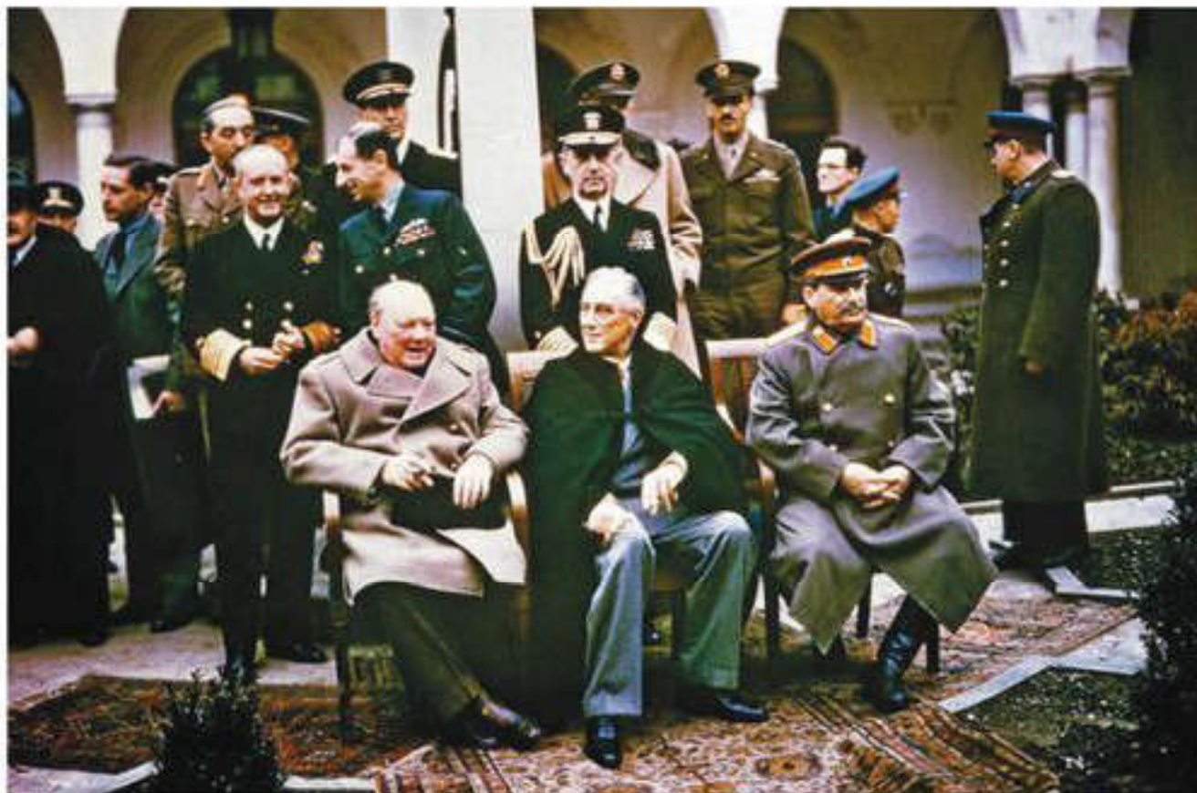
Ялтадағы «Үлкен үштік» конференциясы

1940 жылдардағы Финляндиямен болған «қысқы соғыс» нәтижесінде қалыптасқан шеғарада да өзгерістер болды. КСРО бұдан өзге жана аумақтарға да қол жеткізді: Кенигсберг (қазіргі Калининград), Финляндия шеғарасының солтүстігінде орналасқан Петсамо ауданы, Карпаттық Украина (КСРО мен Чехословкияның 1945 жылғы өзара келісіміне сай), Оңтүстік Сахалин мен Курил аралдары.