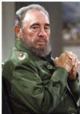
Фидель Кастро Рус (1926–2016)

біркатар өкілдерінің оппозициялық қозғалысы басталды. 50-жылдары революциялық күресті ұсақ буржуазиялық және жұмысшы табына жатпайтын демократиялық революция тобының өкілдері бастады. Ф.Батистаға қарсы күресте Фидель Кастро Рус ерекше белсенділік танытты. 1953 жылы ол Ф.Батистаға қарсы көтеріліс жасауға әрекеттенгені үшін қамауға алынады, одан рақымшылыққа ілініп, шегете эмиграцияға АҚШ-қа, сосын Мексикаға кетеді. 1956 жылы Ф. Кастро заңсыз Кубаға келіп, өз жақтастарымен таулы аудандарға бекініп, Ф.Батистаға қарсы партизандық соғыс бастайды. Біртіндеп партизандарға шаруалар қосылып, сту-