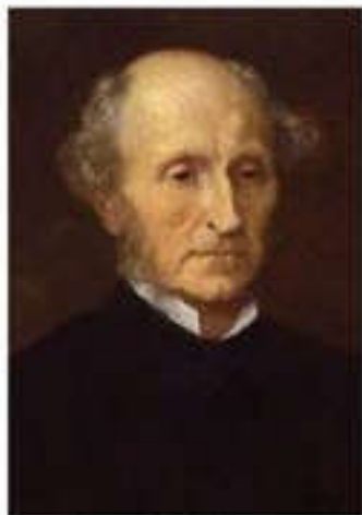
Дж. С. Милль (1806–1873)

Батыс Еуропадағы жетекші мемлекеттерге таралған либералдық идея индустриалдық қоғамның қалыптасуы мен дамуына ықпал етті. Либералдар феодалдық тәртіптердің жойылуына монархияның шектелуіне және парламенттік басқарудың енуіне қол жеткізді.