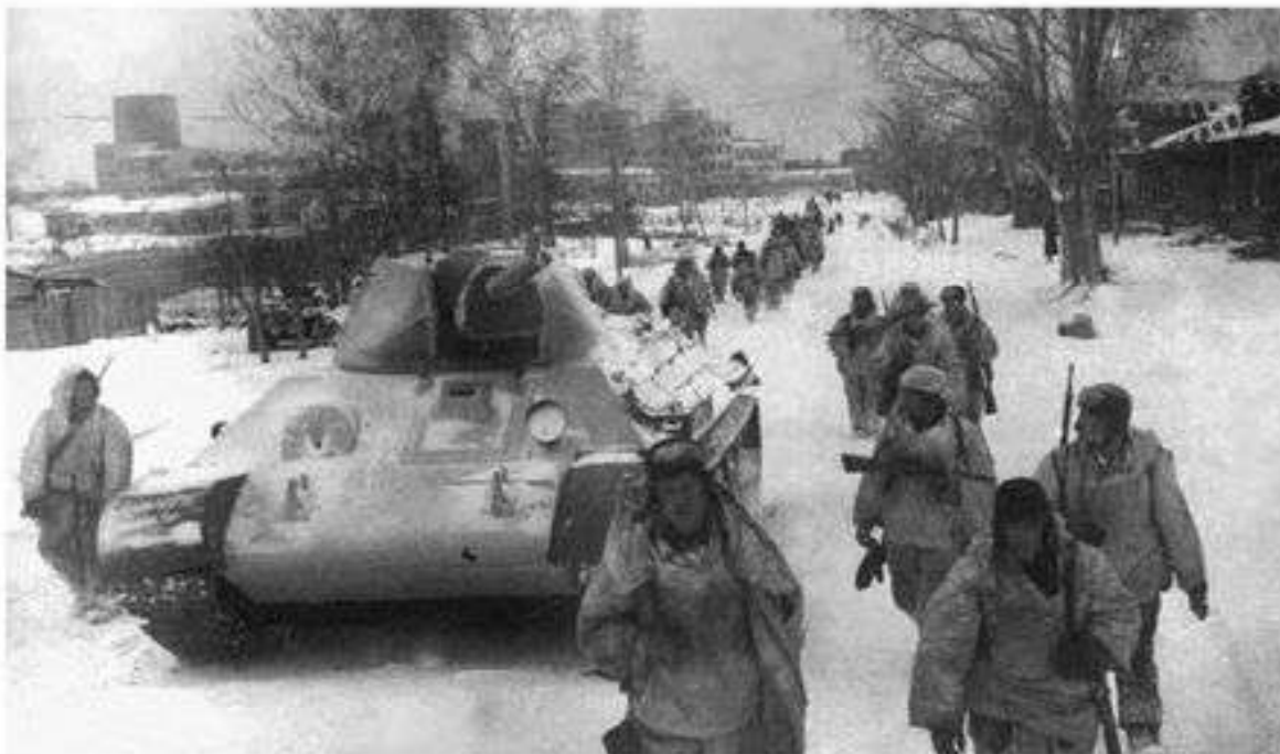
Кенес әскерлерінің Мәскеу түбіндегі қарсы шабуылы. 1941 ж.

бақылауларына алады. Бұдан соң Германия өз әскерлерін КСРО-ның шегарасына шоғырландыра бастайды.