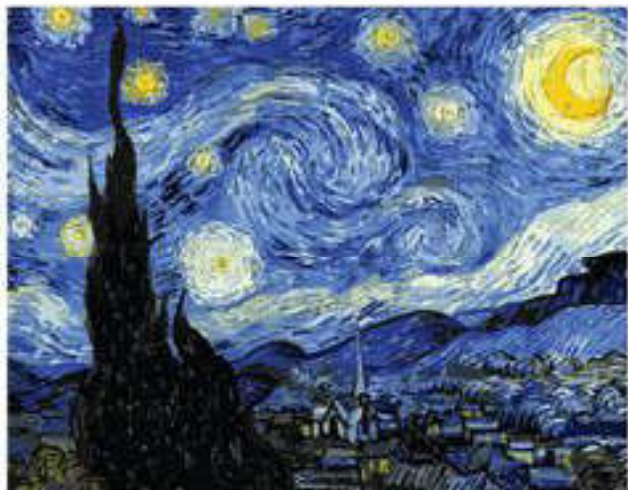
Винсент Ван Гог. Жұлызды түн (постимпрессионизм)

арқылы көркемсурет ашық, нәзік әрі оптимистік сипатқа ие болды. Француз импрессионистерінің бұл жаңалығы басқа елдерге де кең таралды. Импрессионизмдегі бір сәттік қозғалысқа О. Роден секілді белгілі мүсіншілер де қызығушылық танытты.