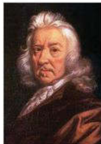
Томас Гоббс (1588–1679)

Томас Гоббс – ағылшын философы. Мемлекетке дейінгі (табиғи) жағдайды Гоббс «соғыстағы секілді бәрі бір-біріне қарсы» деп суреттейді. Ортақ билік пен заң болмаған табиғи жағдайда, барлығы бәріне құқылы. Табиғи құқық пен еркіндік осыдан басталады. Мұндай жағдайда адамның ақыл-есі оған басқа әлемді іздеуге жол ашады. Гоббс ұстанымы бойынша бұл – алғашқы табиғи заңның мәні. Осыдан келіп, бейбітшілік пен қауіпсіздік үшін әркімнен өз табиғи құқықтарын шектеу туралы басқа табиғи заңдар шығады. Аталған табиғи заңдар нәтижесінде адамдар өздерінің ортақ игіліктеріне бағытталған ортақ биліктен тәуелсіз мемлекеттік құрылым құруға ұмтылады.