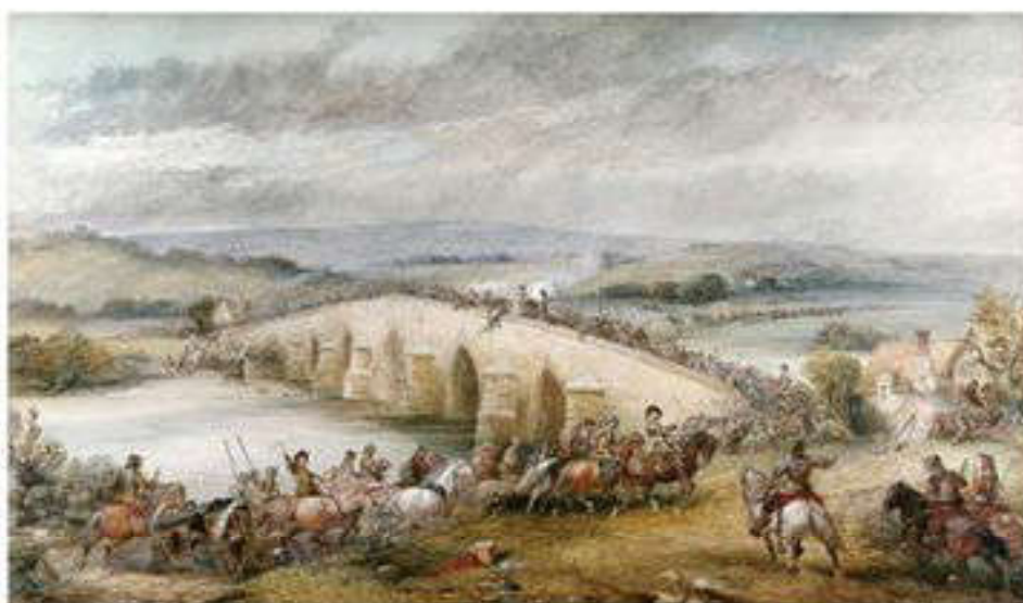
Ч.Каттермол . Ағылшын-буржуазиялық революциясы кезіндегі Престон маңындағы шайқас

Революцияның бұдан кейін дамуы үшін феодалдық қатынастарды жою қажет болды. Бұл тапсырманың шешімін Ұзақ парламенті шешті. 1646 жылы 24 ақпанда олар корольдың пайдасы үшін феодалдық