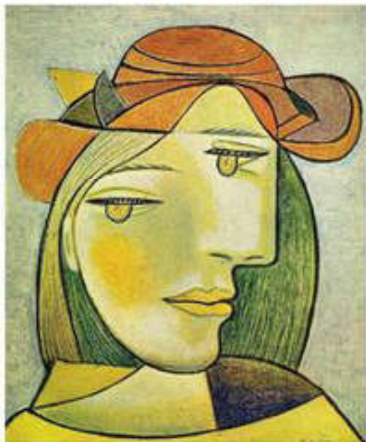
Пабло Пикассо. Эйел портреті (Кубизм)

рауы – куб, конус, цилиндрға, сосын олардан кеңістіктің көлемді формасына ауысуы болды. Бұл суретшіге нысанды бір мезгілде әр алуан тұстан бейнелеуге және өзіндік ерекшелігін қалыптастыруға мүмкіндік береді, ал нысанды классикалық бейнелеуде мұндай мүмкіндік кездеспейді. Кубизмнің ең көрнекті өкілі болып испан-француздық суретші Пабло Пикассо саналады. Ал авангардтықтың өзге ағымы – экспрессионизм – ақиқатты жаңғыртуға ғана ұмтылып қойған жоқ, сонымен қатар автордың көңіл күйін де беруге тырысты. Экспрессионистік көңіл күй сезімін білдіру норвег суретшісі Эдвард Мунканың және постимпрессионисті Винсент Ван Гог