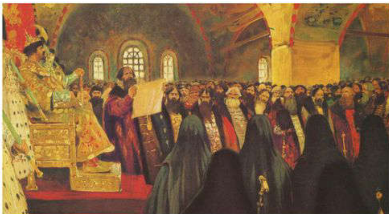
С.Иванов. Ресейдегі Земск соборы

Конституциялық немесе шектеулі монархия – монарх билігінің конституциямен шектелгендігін білдіретін басқару түрі. Монарх шартты түрде ғана жоғары билік иесі әрі сот жүйесінің басшысы болып саналады. Ол формалды түрде ғана үкіметті жасақтап, министрлерді