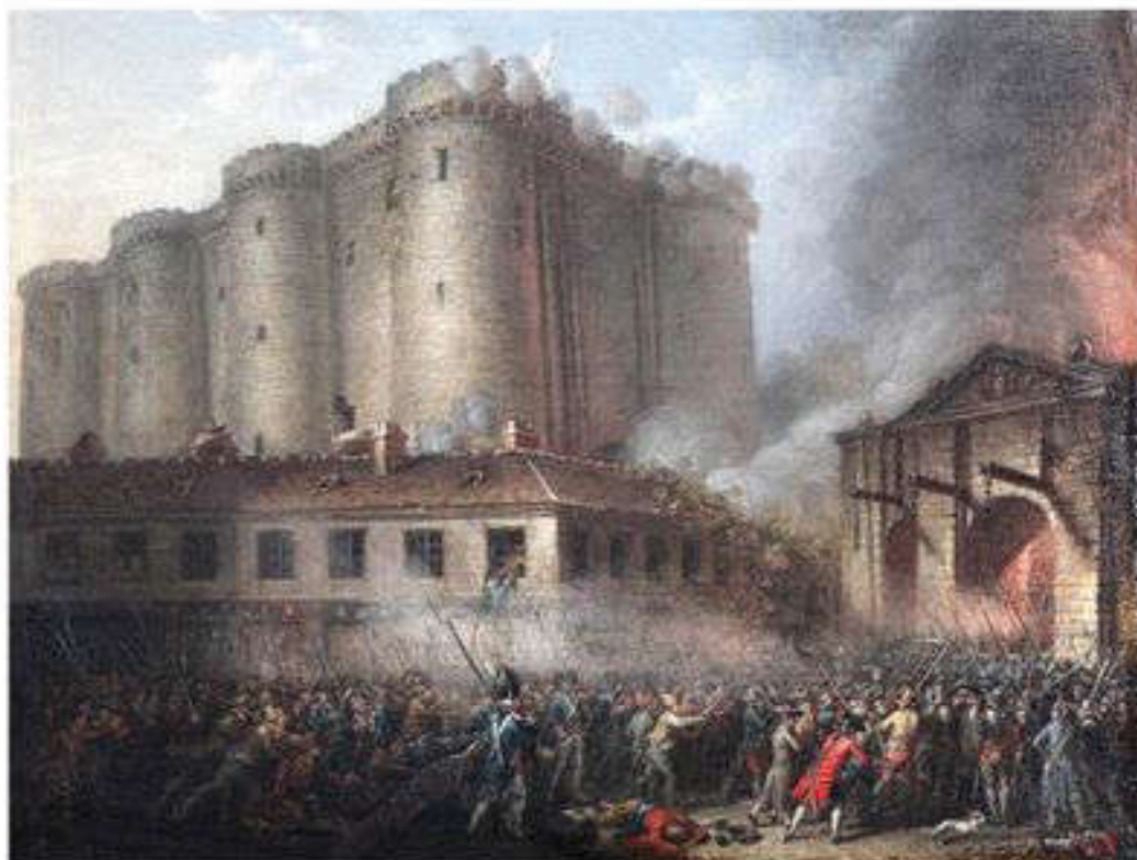
Бастилияның алынуы, 1789 ж., 14 шілде

Революция буржуазияның ең басты мәселесі – аграрлық жағдайды радикалдық түрде шешті. 1793 жылдың 17 шілдесіндегі Декретке сай ауылдарда барлық феодалдық құқық толық түрде күшін жойды. Шаруалардың феодал алдындағы борыштары қайтарымсыз, түгелімен жойылды. Шаруалардың ғасырлар бойы феодалдардан ақы төлеп жалға алып келген жерлері, өздерінің меншігіне өтті.