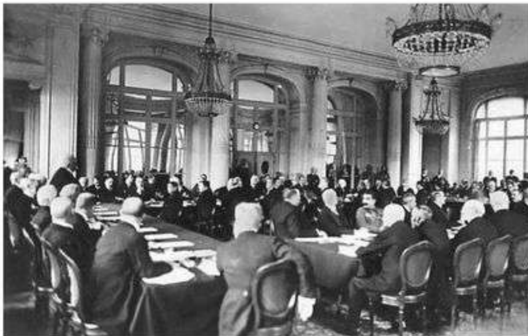
1919 жылы Париж маңындағы бұрынғы король резиденциясында өткен Версаль келісімі

созылған карусыздану аймағы құрылды, мұнда герман әскери базалары мен құрылымдары, барлық әскери қорғаныс бекеттері толық жойылуы тиіс болды. Германияның әскери қуаты бірден қысқартылды: 100 мың ерікті түрде жасақталған әскер, әскери-теңіз флоты аздаған өзгертулермен одақтастар қарамағына берілді. Германияға суасты флотын, әскери авиация ұстауға тыйым салынды, аса ірі корабль жасауға рұқсат берілмеді. Олар айыппұл төлеуге міндеттелді, оның отарларын жеңімпаздар өзара бөліп алды.