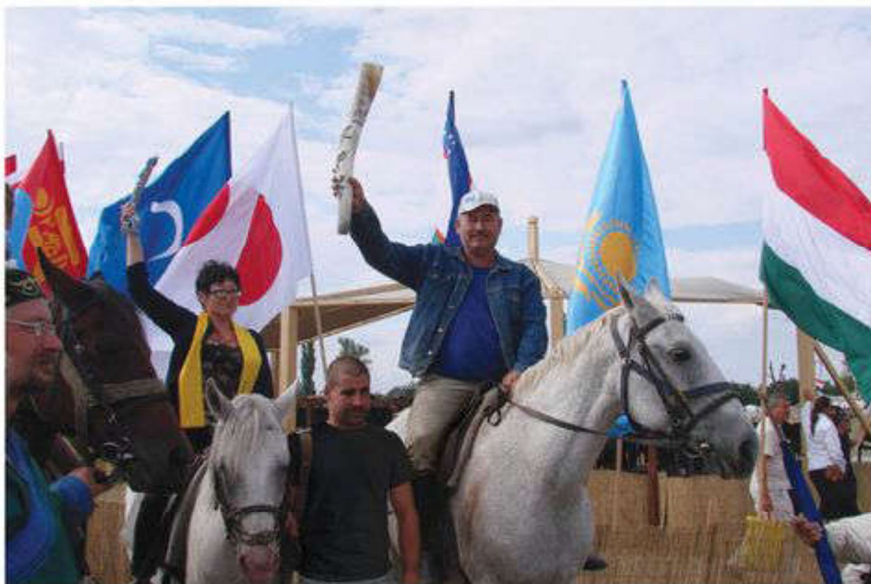
Венгриядағы түркі халықтарының фестивалі, 2012 ж., тамыз

Тарихи оқиғалар желісіндегі құндылықтардың трансформациясы. Жалпыадамзаттық құндылықтарды адам мен адамзат қоғамы тудырды. Тіпті үнгірдегі адамдардың өздері де, қазіргі замандағы адамдар секілді жастық қуат пен денсаулықты, рақат өмір мен қауіпсіздікті ұнатты. Бүгінгі таңдағы кейбір басты құндылықтар ерте заманда ондай мәнге ие емес еді. Мысалы, бүгінгі таңда ең басты құндылық саналатын адам өмірі адамзаттың алғашқы кезеңдерінде түкке тұрғысыз, құнсыз бола-