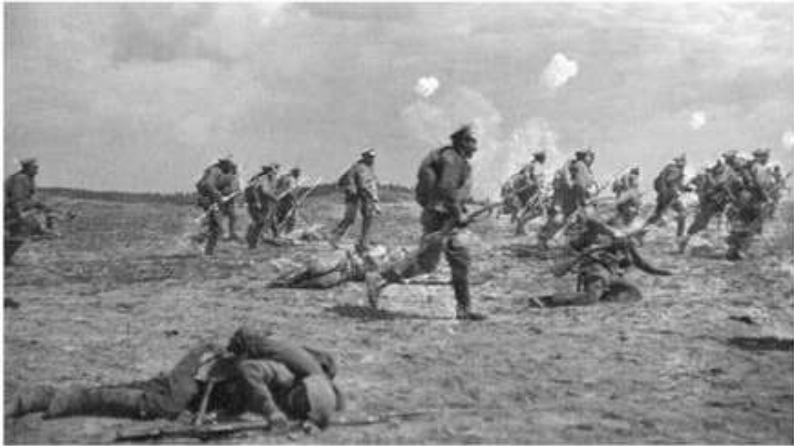
Орыс әскерінің генерал А.Брусиллов қолбасшылығымен шабуылы. 1916 ж.

Соғысқа Болгарияның қосылуынан Төрттік одақ құрылды (Германия, Австро-Венгрия, Түркия және Болгария). Италия бұл соғыста Балкандағы Адриат жағалауын пеленуді ойлап, Антантаны қолдады. Алайда итальяндықтар австриялықтармен болған шайқаста жеңіліске ұшырайды. 1915 жылғы жорық Төрттік одаққа стратегиялық басымдылық әкелді.