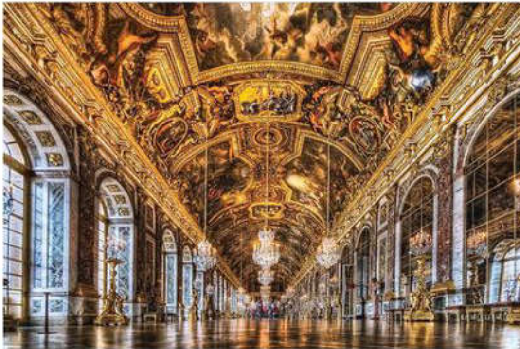
Уффици галереясының залдары

сыйлықтарымен және үздіксіз сатып алулармен тұрақты толықтырылып тұрады. Галерея жинағының мақтанышы Боттичеллидің («Көктем», «Венераның тууы») Леонардо да Винчидің («Бақсылардың табынуы», «Ізгі хабар», «Христтің шоқынуы»), Тицианның («Венера Урбинская») белгілі туындылары болып табылады.