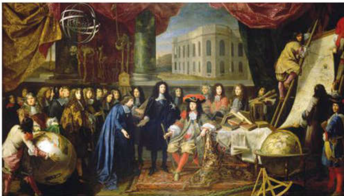
А.Тестлен. Кольбер XIV Людовикке ғылым академиясының ғалымдарын таныстыруда. 1667 ж.

ауыстырады, әскери және полиция күштеріне өкім жүргізуге, жарлықтар беруге, парламент қабылдаған заңдарды тоқтатуға немесе олардың күшіне енуін реттеуге; заңдық бастамалар ұсыну мен парламентті тарату құқығына ие. Іс жүзінде бұл өкілеттіліктер үкіметтің құзырында болады, ал монарх «патшалық құрады, бірақ билемейді».