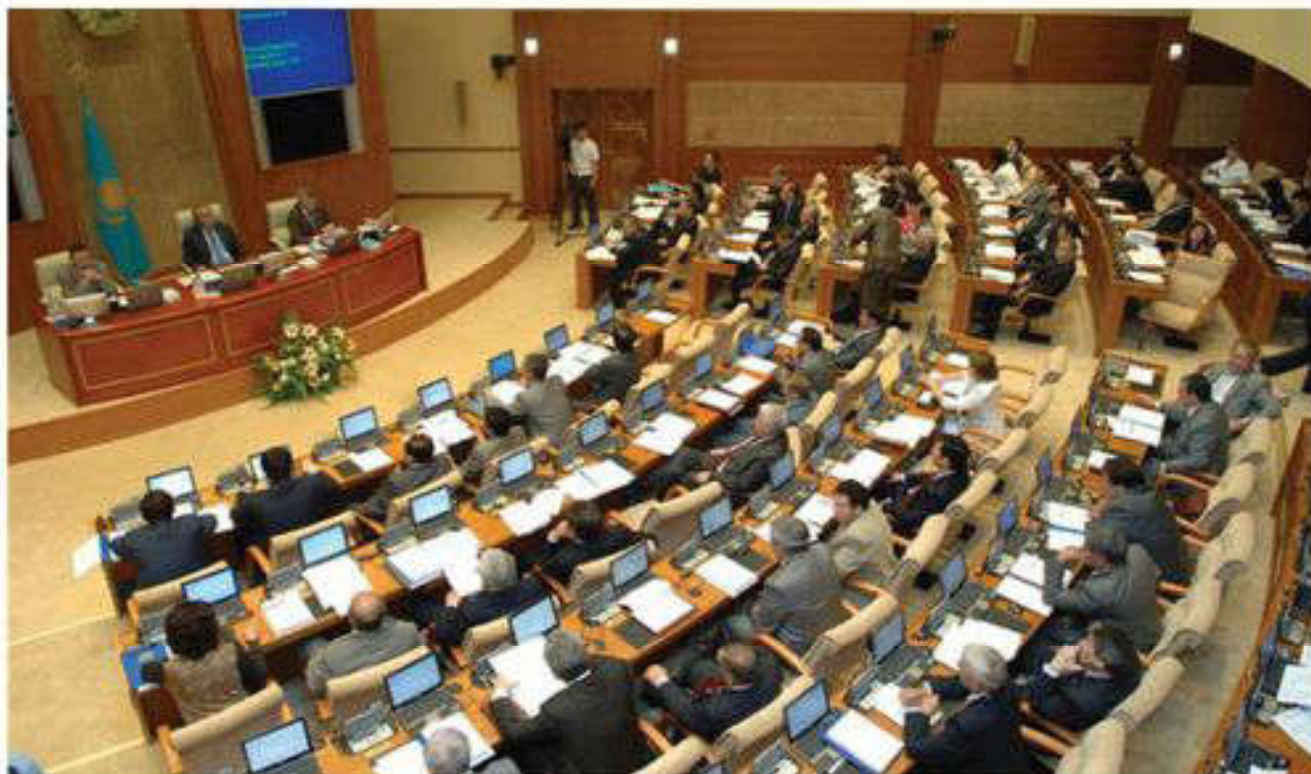
Қазақстан Республикасындағы Парламент отырысы

Президенттік республика бойынша президент бір мезгілде мемлекет басшысы және атқарушы биліктің басшысы болып табылады. Мұнда АҚШ классикалық президенттік республикасындағы үкімет секілді мемлекеттік биліктер болмайды, үкіметтің қызметін президент әкімшілігі атқарады. Ал үкімет қызмет атқаратын президенттік республикаларда үкімет қызметі президенттің бақылауында болады. Президент үкіметтің саяси қызметін бақыласа, премьер-министр үкіметтің жұмысын ұйымдастырумен айналысады.