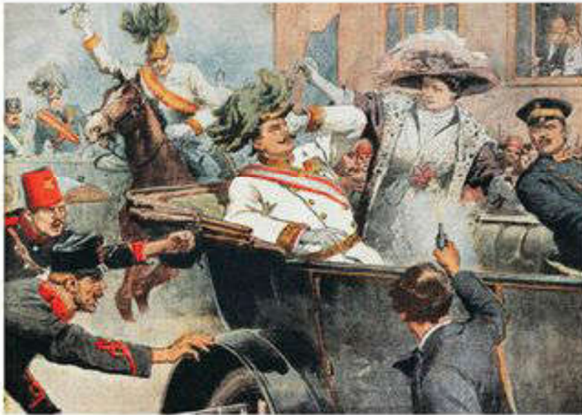
Сараевода Австриянын тақ мұрагері Франц-Фердинандтың өлтірілуі

жеңіске жетті. Алайда 26–30 тамыз аралығында Мазурск батпағында өткен кескілескен ұрыста тас-талқан болып жеңіліске ұшырады. 2-орыс әскерінің қолбасшысы генерал А.В.Самсонов штабымен бірге қоршауда қалады. Ал Кавказ маңында түрік әскерлері мен орыс әскері арасында кескілескен ұрыс басталып, Қара теңізден Урми көліне дейін созылған Кавказ майданы құрылды.