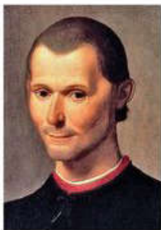
Н. Макпавелли (1469–1527)

бермейді. Мемлекет өз даму биігіне жеткен соң, кері бағыт – регрессияға ұшырайды. Осы себепті тарихта мемлекеттердің дамуы мен құлдырауы жиі кайталанды. Макпавелли басқарудың 3 жақсы формасын (монархия, аристократия, демократия – халық билігі) және басқарудың 3 нашар формасын (тирания, олигархия және анархия) атап көрсетті. Сондай-ақ ол мемлекеттік басқарудың екі заманауи түрін бөліп көрсетеді: монархия және республика. Бұлардың айырмашылығы жоғарғы билік институттарын қалыптастыру жолдарына байланысты. Осы формалармен қоса басқарудың теократиялық формасы да бар.