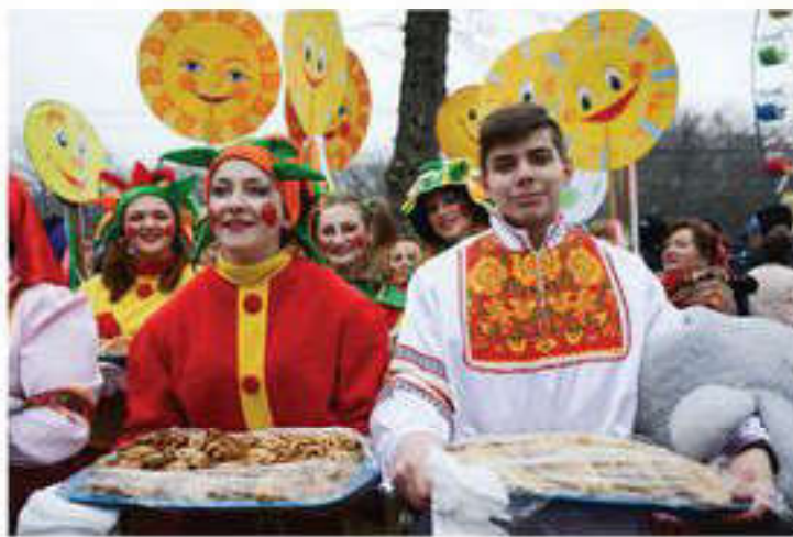
Славян халықтарының дәстүрі