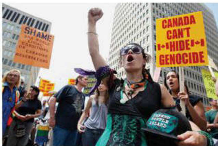
Жаһандануға қарсы қозғалыстар

Тұтынушылық психология негізіне маркетингтер өз тауарларын қалай тиімді өткізуді (бұл ғылым әлемде 1960 жылдардан бастап дами бастады) зерттеп жүрген психологиялық тұтыну емес, керісінше адамның сатып алуға қатты тәуелді болуы, яғни тұтынушылық (консюмеризм) жатады, бұл – көбінесе абыройлы әлеуметтік топқа жақын болу мақсатынан туындайтын әдеттер.