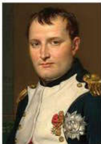
Наполеон Бонапарт (1769–1821)

XIX ғасырдың алғашқы он жылдығында француз экономикасының барлық саласы күрт дамыды.