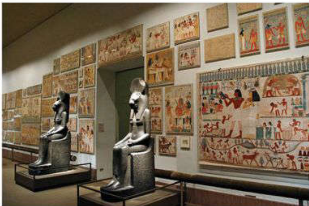
Нью-Йорк мұражайындағы Египеттік өнер туындылары

Бүгінгі күні тұрақты коллекцияда өнердің 2 млн-нан астам туындылары бар. Метрополитен өзінің импрессионистер мен постимпрессионистердің коллекциясын мақтан ете аталады. Дүниежүзіндегі Египет өнерінің толық жинағы осы мұражайда деп есептеледі. Гравюралар жинақтамасы өте көлемді. Фотосуреттердің үлкен коллекциялары бар. 2013 жылы коллекционер Леонард Лаудер мұражайға құрамында кубизмнің 78 туындысы бар өз коллекциясын сыйлады, оның ішінде Пикассоның 33 жұмысы бар болатын. Әр жыл сайын мұражай «Жылдық есеп» жариялайды, онда жана толықтырулар санамаланады. 2017 жылы ақпанда мұражай өз коллекциясында көркемсурет жұмыстарының 375 000 цифрланған бейнелерін жалпыға қолжетімді етті.