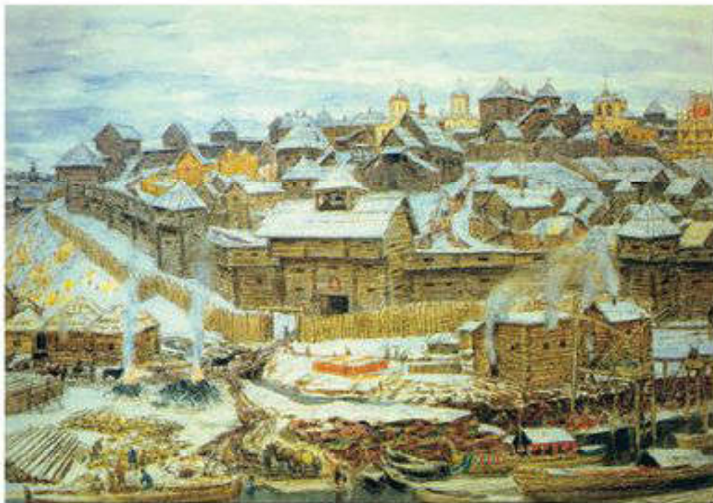
В.Васнецов. Ежелгі Мәскеу

Мәскеудің өркендей бастауы. 1260–1270 жылдары Мәскеу князьдігі Солтүстік-Шығыс Русьтегі Владимирдің ұлы князьдігінен бөлініп шықты. Бұл уақытта Литва–Русь мемлекеті мен Тверь князьдігі күшейіп, ал Мәскеу князьдігі әлсіреп тұрған еді. Сондықтан ол өзінен қуатты князьдіктерге бағынышты болды. Александр Невский өзінің өспетінде Мәскеуді кіші баласы екі жасар Даниилға табыстайды. 1263 жылы Александр Невский қайтыс болған соң Мәскеудің алғашқы князінің тәрбиешісі мен қамқоршысы оның ағасы – тверьлік ұлы князь Ярослав Ярославич Тверской болды. 1273 жылы ағасы қайтыс болған соң, ол өз бетінше билік жүргізе бастады. Бұл уақытта князьдің жасы он бірде болатын.