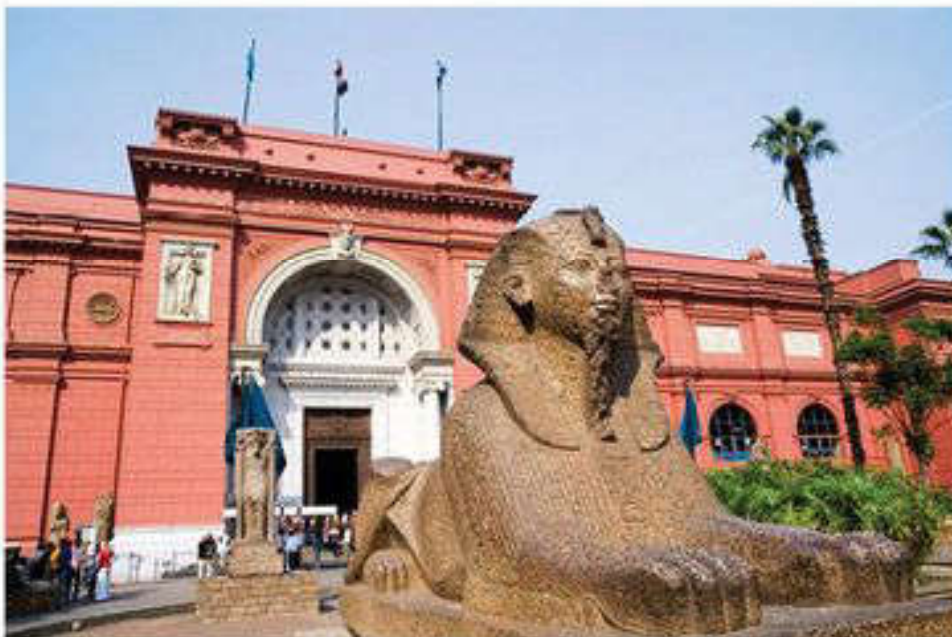
Египет ұлттық мұражайы

кезендеріндегі 160 мыңдай жәдігер бар. Негізі 1858 жылы қаланған. Мұражайдың жаңа ғимаратта ашылуы 1902 жылы болып өтті.