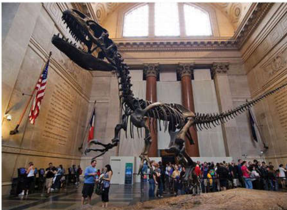
Нью-Йорктегі Америкалық өлкетану тарихи мұражайы

жартысында Францияда, Швейцария, Германия мен Италияда табиғи заттар кабинеті түрінде пайда болды. Ресейде табиғи заттарды мұражай жинақтамаларына пайдалану XVIII ғасырдың 20-жылдарынан басталады (I Петр құрған Кунсткамера үшін). Табиғи заттар кез келген жаратылыстану-ғылыми мұражайдың негізі болып табылады. Антикалық уақыттан бастап табиғи заттар жинақтарының бәрі табиғаттың үш «патшалығына»: өсімдік, жануарлар мен минералдар болып үш топқа бөлінді. Табиғи заттар «табиғат патшалығында» болып жатқан процестер мен құбылыстарды, нысандарды білдіреді (зоологиялық, ботаникалық, минералогиялық мұражайлар). Олардың ішкі айырмашылықтары географиялық және биологиялық ғылымдардың бөлінуімен байланысты. Табиғи заттардан бөлек, мұражайларда олардың модельдері, көшірмелері мен мүляждары жиі кездеседі. Табиғи заттардың модельдері палеонтологиялық мұражайларда неғұрлым жиі кездеседі, бұл – жануарлар мен өсімдіктер дүниесінің тұрпатын қалпына келтірудің басты нысаны. Әрбір жойылған жануарды экспозицияда көрсету ғылыми жаңғырту болып табылады. Жаратылыстану-ғылыми мұражай экспозицияларында бейнелеу материалдары, карталар, сұлбалар, диаграммалар пайдаланылады.