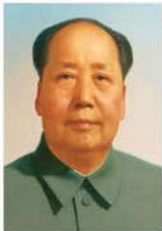
Мао Цзэдун (1893–1976)

Екінші дүниежүзілік соғыстан кейін Қытайдың саяси бірігуі туралы мәселе тағы көтерілді. Мемлекеттегі екі саяси күш – Қытай коммунистік партиясы Орталық Комитет төрағасы Мао Цзэдун мен Гоминьдан «Ұлттық партиясы» Чан Кайши басқаратын партиялар арасында мемлекетті жеке-дара басқару үшін талас жүрді. 1946 жылы Гоминьдан әскері Қытай коммунистік партиясы басқаратын аудандарға өз әскерлерін кіргізеді. Азамат соғысы басталады. 1947 жылдың ортасына дейін созылған соғыстың алғашқы кезінде АҚШ-тың қолдауына сүйенген, әскері жақсы дайындықтан өткен Чан Кайши жеңіске жетеді.