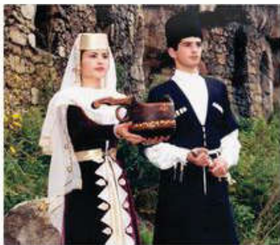
Кавказ халықтарының дәстүрі

АҚШ пен Латын Америкасындағы мемлекеттерде құл иеленушілік XIX ғасырға дейін болды. Ресейдегі шаруаларды басыбайлылықтан босату қозғалысы мен Америкадағы құлдыққа қарсы күрес