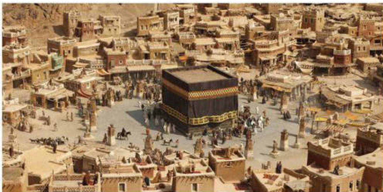
Ежелгі Мекке және Қағба

Исламның қатаң монотеизміне және тайпалық жіктелуге қарамастан барлық мұсылмандардың бауырлас саналуы Араб елдерінің бірігуіне оң әсер еткен идеологиялық күш болды. Араб тайпалары жаңа дінді