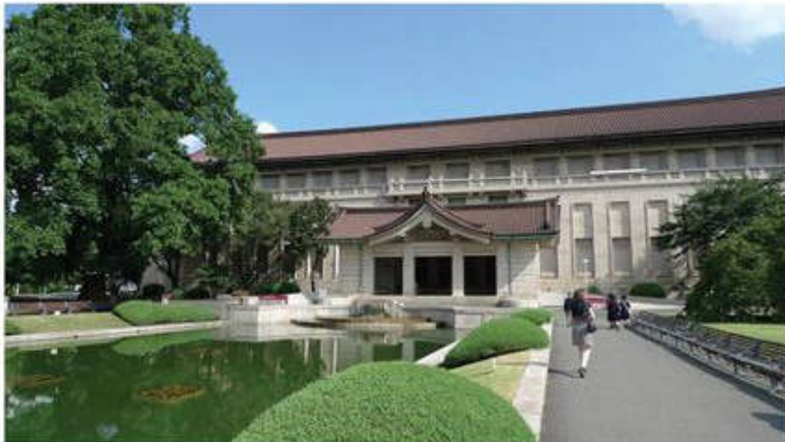
Токио ұлттық мұражайы

Бұл жерде жапон мәдениетінің ежелгі заманнан қазіргі уақытқа дейінгі даму жолдарын қадағалауға мүмкіндік беретін бейнелеу және қолданбалы өнер туындылары, тарихи және этнографиялық материалдар жинақталған. Салтанаттық корпусы 1909 жылы ашылды. Оның ғимараты Мэйдзи дәуіріндегі (1868–1912) батыс стиліндегі сәулет өнерінің аса көрнекті ескерткіші болып табылады (сәулетші Токума Кагаяма) және мұражай шеңберінде ағартушылық орталық болып табылады. Ол жерде ғылыми қоғамдастықтар жұмыс істейді, семинарлар өткізіледі.