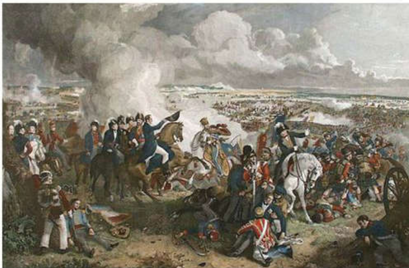
Ватерлоо түбіндегі шайқас. Робинсон картинасынан фрагмент

Наполеонның Рейн одағы мен Вестфаль корольдығын құруы, қоғамдағы діннің ықпалын азайтуы, Азаматтық кодекстің енгізілуі Германияда саяси өзгеріс орнатты. Осының нәтижесінде 200-ден астам ұсақ елге бөлінген неміс халқының басы бірігіп, біртұтас мемлекет болып қалыптасты. Наполеонның кодексі енген Италияда шаруалардың бұған дейін сақталған басыбайлылығы біржола жойылып, жер иеленушілердің заңдары орнады. Наполеонның ішкі шегараларды жойып, бірыңғай заң жүйесі мен жалпы әскери бағыныштылықты