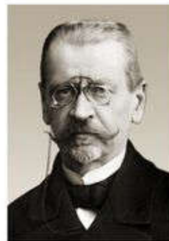
Л.Н. Петражский (1867–1931)

сының құрылымымен байланыстырады. Бұл, бір жағынан, басқа адамдарға билік жүргізу қажеттілігімен, екінші жағынан, бағыныштылыққа еліктеушілігімен түсіндіріледі. Бірінші билікпен еш келіспейтін, агрессияға бейім адамдар әр уақытта кездеседі. Бұл теория өкілдерінің пікірінше, мемлекет психологиялық карама-қайшылықтағы белсенді тұлғалардың ортақ тіл табысуына жағдай жасауы керек. Жауапты шешім қабылдауға қабілетті тұлғалар белсенділігі төмен бұқараның мәселесін шешуге қолдау көрсетуі тиіс. Мемлекет кейбір агрессиялы дара тұлғаларды басуы қажет.