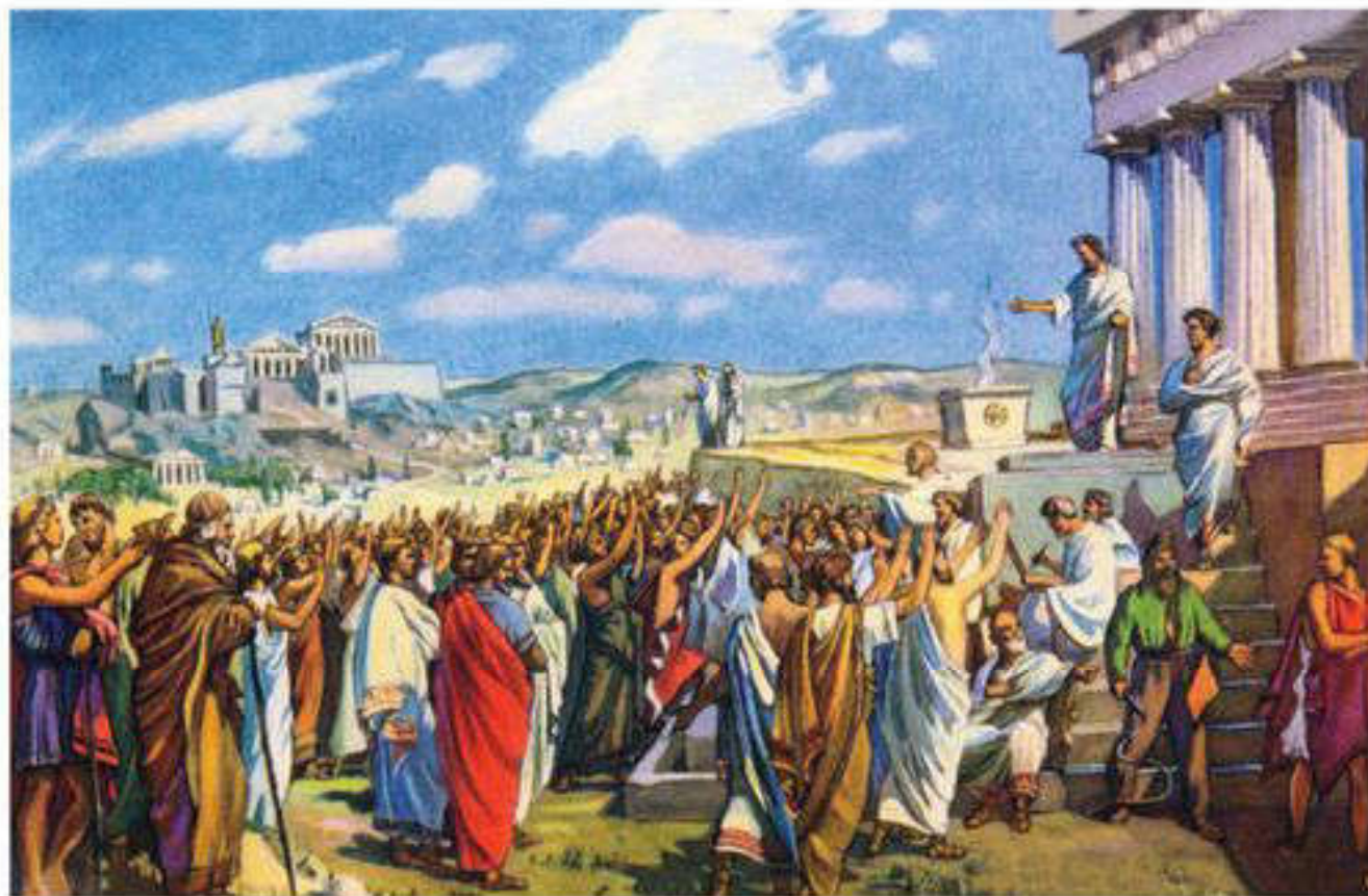
Афиныдағы халық жиыны

тың жана сипатқа сай қалыптасу қажеттілігінен туындады. Алайда XVIII ғасырдың өзінде демократияға деген жағымсыз көзқарас әлі де сақталған болатын. Бұл ұлттық мемлекеттер секілді үлкен саяси құрылымдарды басқаруға барлық азаматтарды күнделікті және тікелей қатысуға шақыратын идеалды демократиялық модельдің жүзеге асуы мүмкін еместігімен түсіндіріледі. Қоғамның қарқынды даму себебіне орай белең алып келе жатқан көптеген әлеуметтік мүдделер басқару қызметтерін күрделендірді. Нәтижесінде халық билігі ретінде демократияның өзіндік мағынасы билікті жүзеге асырудың нақты механизмдерінен ерекшеленеді.