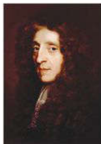
Джон Локк (1632–1704)

Джон Локк – ағылшын философы. Ол да Гоббс секілді адамдарды алғашқы табиғи жағдайында қабылдады. Бірақ Гоббстан айырмашылығы – оның жағдайын саналы адамдар қалпында ұсынды. Табиғи жағдайда адамдарға табиғи еркіндік ( өмір, бостандық, жекеменшік секілді) тән болады. Сондықтан адамдарды толғандыратын негізгі мәселе өз өмірлері мен бостандықтарын, мүліктерін бірлесе қорғау мәселесі болды. Адамдардың ортақ келісімімен құрылған мемлекет қана адамның табиғи жағдайда қол жеткізе алмаған мүмкіндіктеріне жол ашады.