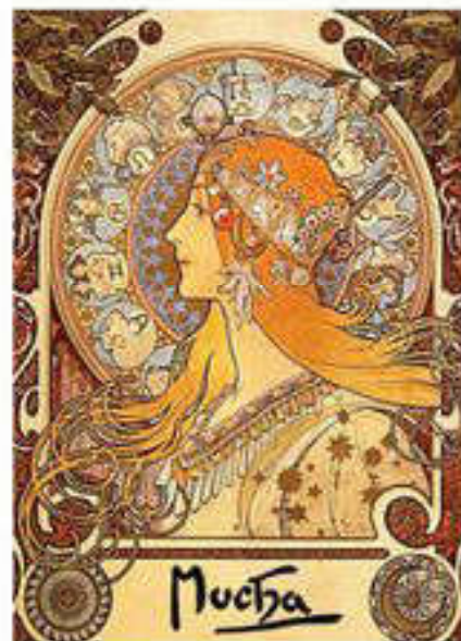
А. Муха. Әйел бейнесі (Модерн)

үшін мозанка, эмаль, алтын көріністер пайдаланылды. Ар-нуво бағытының өркендеуі қазіргі қолданбалы өнер мен дизайнның бастауы болды. Модернде екі айрықша: конструктивті (Австрия, Шотландия) және сәндік (Бельгия, Франция, Германия) бағыт қалыптасты. Сондай-ақ оған Италия мен Ресей ұлттық салт-дәстүрлері ерекше ықпал етті. Париж бен Санкт-Петербуркте және Еуропаның көптеген қалаларында модерн стилінде салынған көптеген үйлер, тіпті аудандар да кездеседі. Бұл бағыттың көрнекті өкілдері болып суретшілер Г.Климт, А.Муха, Л.Бакст саналады. Классикамен салыстырғанда, импрессионизм мен символизм және ар-нуво өздерінің бар ерекшеліктері бойынша ескі өнерге қатаң радикалды болған жоқ. Мысалы, импрессионистер – шындық ақиқат қалыптары, акын-символистер – шумақтар мен ырғақтарды, ал модерн стиліндегі сәулетшілер алуан түрлі элементтерді жинақтаған бұрынғы архитектуралық бағыттағы, эклектикалық стильді сақтады. Алайда XX ғасырдың басында өнерде авангардистік деп аталатын, радикалды, төңкерістік ағым пайда болды.