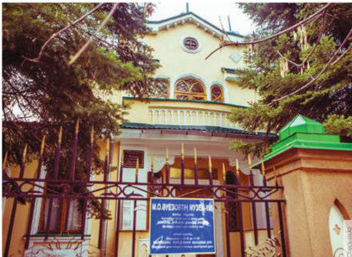
Алматыдағы М.О.Әуезов мұражайы

• Этнографиялық мұражайларда этникалық қауымдастықтардың дәстүрлі материалдық және рухани мәдениет пен тұрмыс заттары (тұрмыстық, халықтың кәсіптік пен колөнер бұйымдары, этникалық киім, музыкалық халық аспаптары және т.б.) жинақталған.