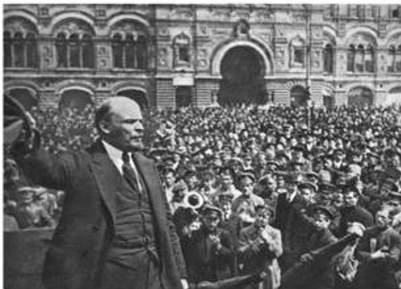
В.И.Ленин Қызыл алаңда

банк пен көптеген үкіметтік мекемелер секілді аса маңызды жерлерді басып алды.