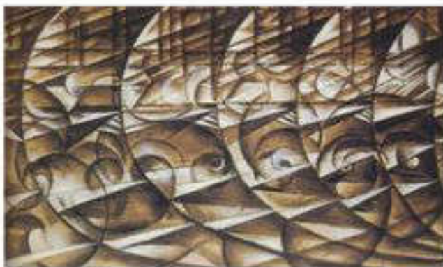
Д. Балла. Абстрактты жылдамдық (Футуризм)

Сюрреализмді ұстанушылар өнердің негізі деп сананы (түйсік, түс көру, елес көруді), ал оның әдістері деп логикалық байланыстардың үзілуін, олардың еркін қауымдастықтармен алмастырылуын санады. Сюрреализм 1920 жылдары қалыптасты. Бұл бағыттың идеологі болып, «Сюрреализм манифесінің» алғашқы авторы, (1924) жазушы Андре Бретон саналды.