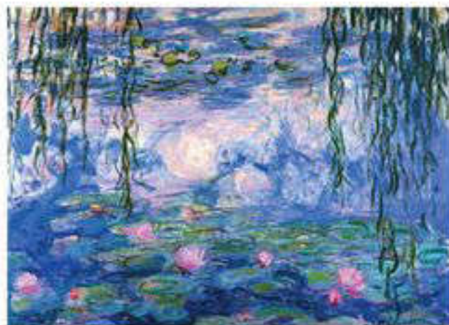
К. Моне. Су лалагүлі (импрессионизм)

Бір сәттік заманауилықты бейнелеу, әсіресе импрессионизмде ерекше көрініс берді, осы бағытты ұстанушылар шынайы өмірдің бір орында тұрмайтын және өзгермелі екендігін бейнелегісі келді. Импрессионизм Францияда 1860 жылдары Э.Мане, О.Ренуара және Э.Деганың шығармаларында пайда болды. Бұл суретшілер өнерге бұрын-соңды болмаған нәзік жеңілдік пен өмірді тікелей қабылдау әкелді, бір сәттік бейнелер мен кездейсоқ қозғалыстарды, жағдайларды қалыптастырды, көзқарастар мен бетбұрыстар бағытын қалыптастырды. Импрессионистердің сыртқы ақиқат бейнелері сақталғанмен де, ол өзгеріске ұшырап кетті. Кейінгі онжылдықта К.Моне, К.Писсарро мен А.Сислей бұрынғыдай дәстүрлі түрде тек шеберханада ғана жұмыс атқармай, суретшілерді көшеге пленерге 2 алып шықты. Ашық аспан астында жұмыс істеген импрессионистер шағылысқан сәулелердің көрінісін, бояулардың алуан түрін, түрлі формалар мен жарық пен ауаның әсерін қалыптастырды. Импрессионистердің түрлі күрделі бояуларды қолдануы