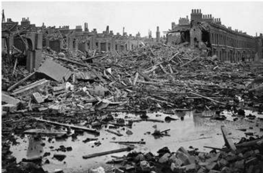
Лондонның белгілі бір ауданына неміс авиациясының шабуылынан кейінгі көрініс. 1940 ж.

келіспеушілікке орай Кеңес-фин соғысы басталады. Ол 1940 жылы наурызда аяқталып, бейбіт келісімге қол қойылады. Келісім нәтижесіне орай Финляндия КСРО-ға жерінің біраз бөлігін береді. 1940 жылдың мамырында Германия Дания мен Норвегияны басып алып, Атлант мұхиты аймағы үшін болатын соғыста өзіне тиімді жағдай жасайды. 1940 жылы 10 мамырда Германия Францияға шабуылға шығып, оның жерінің 2/3 бөлігін басып алады, бұдан соң Германия Бельгия, Нидерланд және Люксембургті өзіне қаратады. Бұл уақытта Балтық жағалауы елдерінің жаңа кеңесшіл үкімет басшылары референдум өткізіп, КСРО-ның құрамына өтеді. КСРО Румыниядан Бессарабияны қайтаруды және өз құрамына Буковинаны қосуды талап етеді.