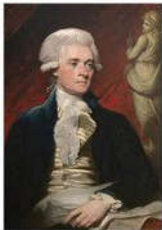
Томас Джефферсон (1743–1826)

Табиғат жағдайына орай солтүстік колонияларда капиталистік фермерлік секілді шаруашылық дамыса, оңтүстікте жедел түрде темекішаруашылығы мен плантациядағы құлпеленушіліктің бұрмаланған буржуазиялық қатынасы болды.