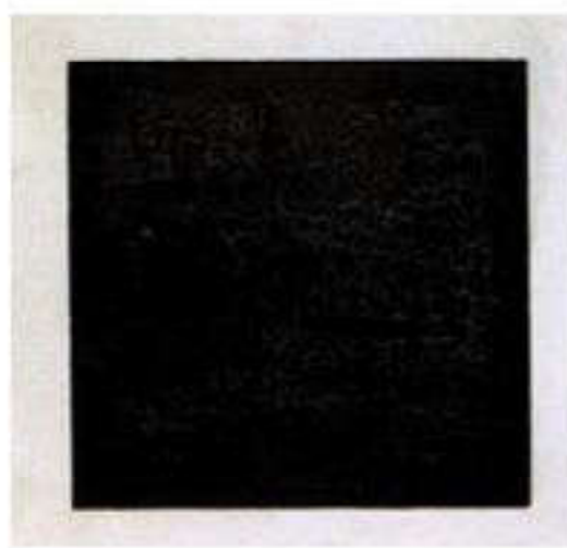
К.Малевич. Қара шаршы. (Супрематизм)