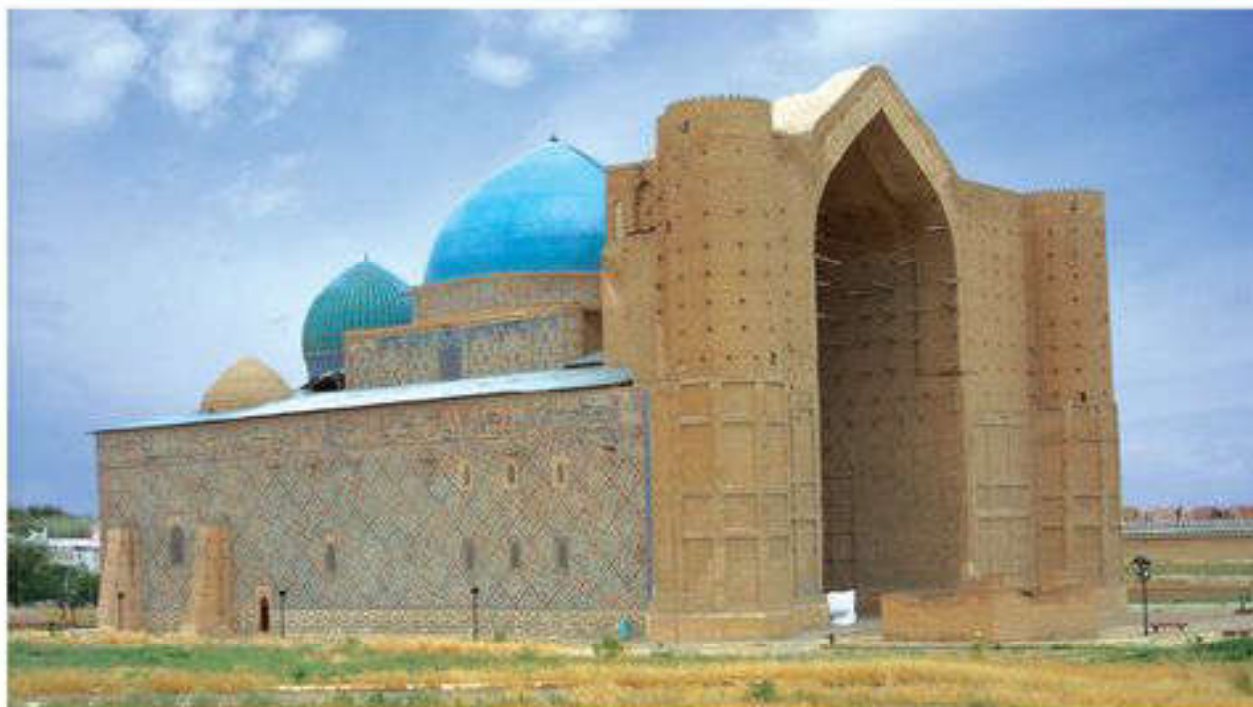
Қожа Ахмет Ясауи кесенесі ЮНЕСКО-ның бүкіл дүниежүзілік мұра тізіміне енгізілген

зілік құнды түрлердің сақталуы үшін неғұрлым маңызды немесе елеулі табиғи ортаны қамтиды.